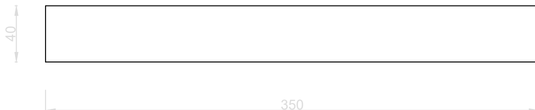
WIDOK Z GÓRY