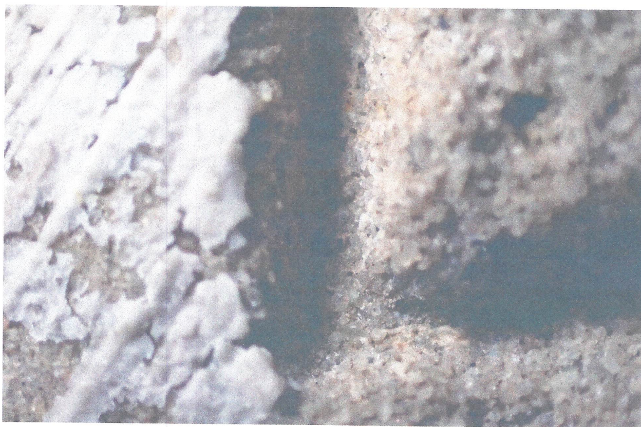
FOT. 13. WNĘTRZE LITERY Z TABLICY INSKRYPCYJNEJ