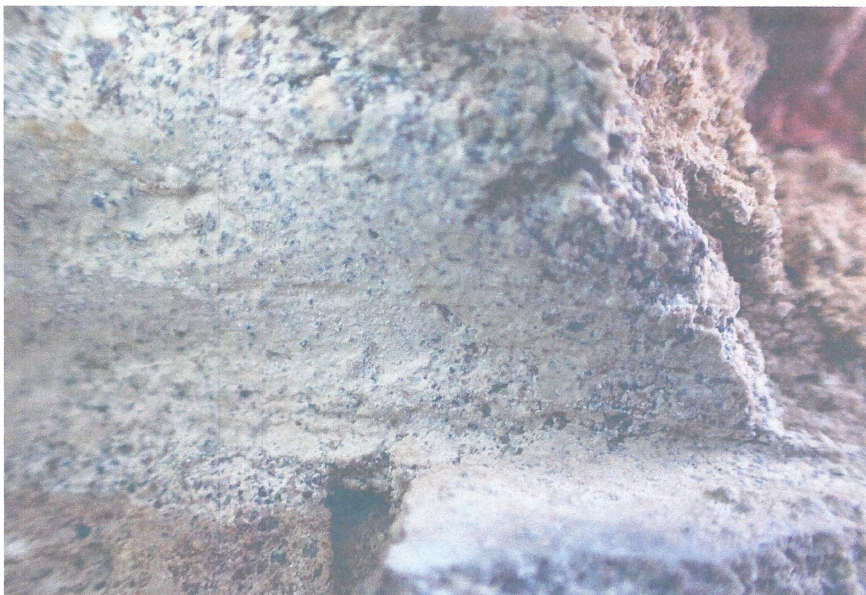
FOT. 11. MAKROFOTOGRAFIA POKAZUJĄCA DWIE POBIAŁY NA WTÓRNYM TYNKU Z FOT. 10.