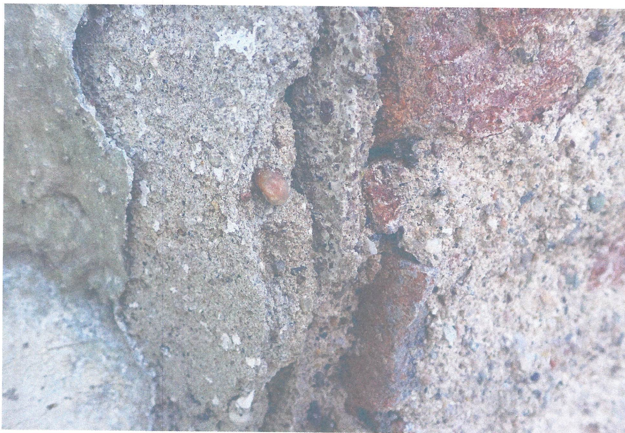
FOT. 9. MIEJSCE WYKONANIA MAKROFOTOGRAFII NR 8