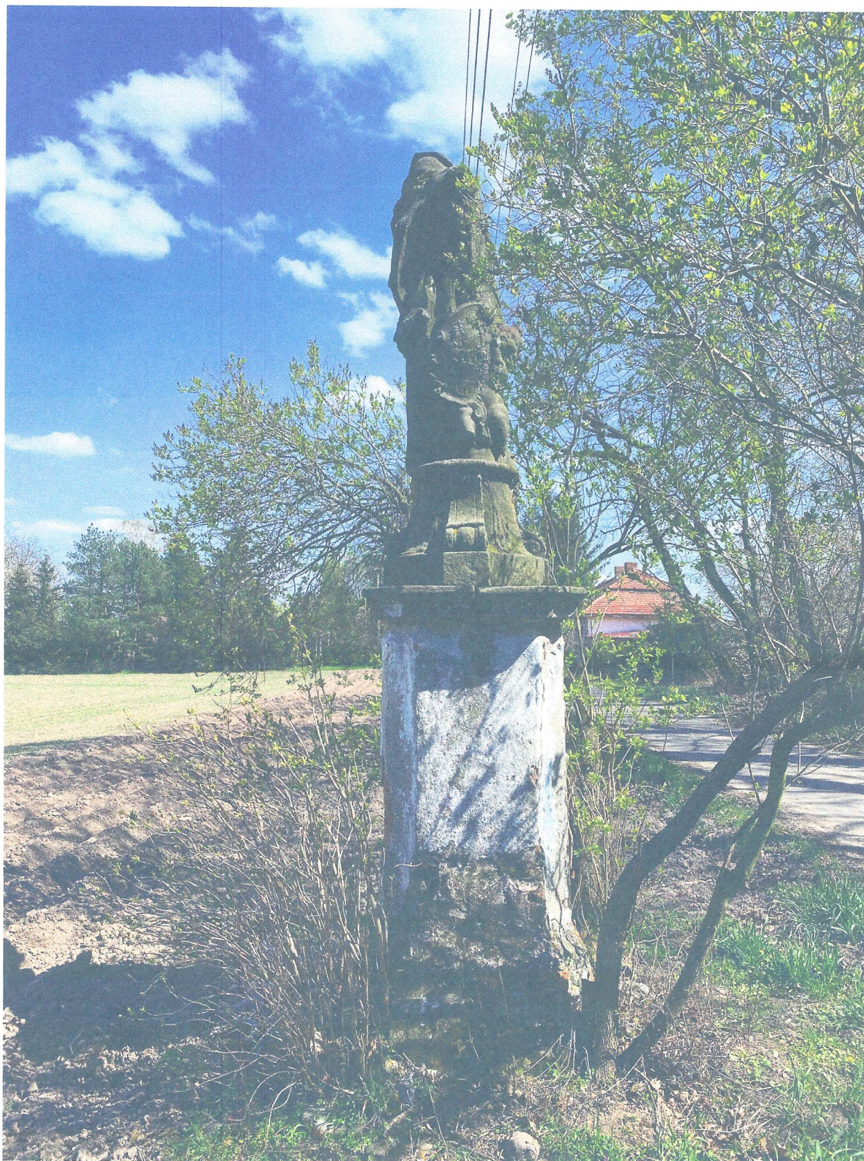
FOT. 3. OGÓLNY WIDOK POMNIKA Z BOKU