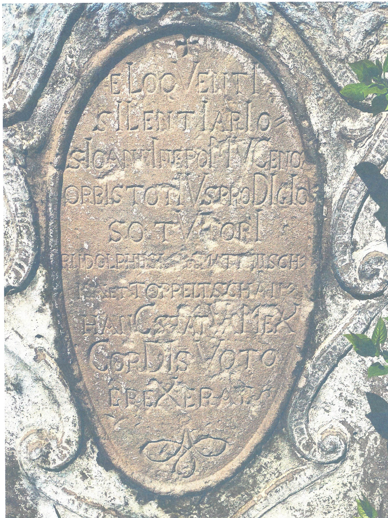
FOT. 5. PŁYTA INSKRYPCYJNA