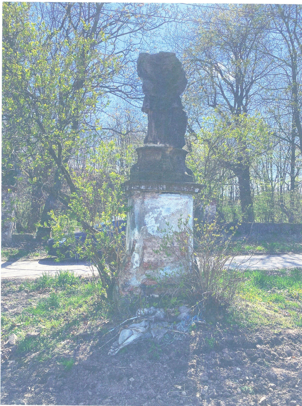
FOT. 2. OGÓLNY WIDOK POMNIKA Z TYŁU