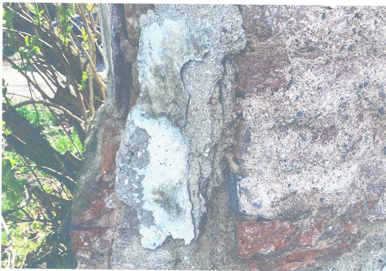
FOT. 7. CEGLANY COKÓŁ - WTÓRNE ZAPRAWY I PRZEMALOWANIA NA ZNISZCZONYCH CEGŁACH