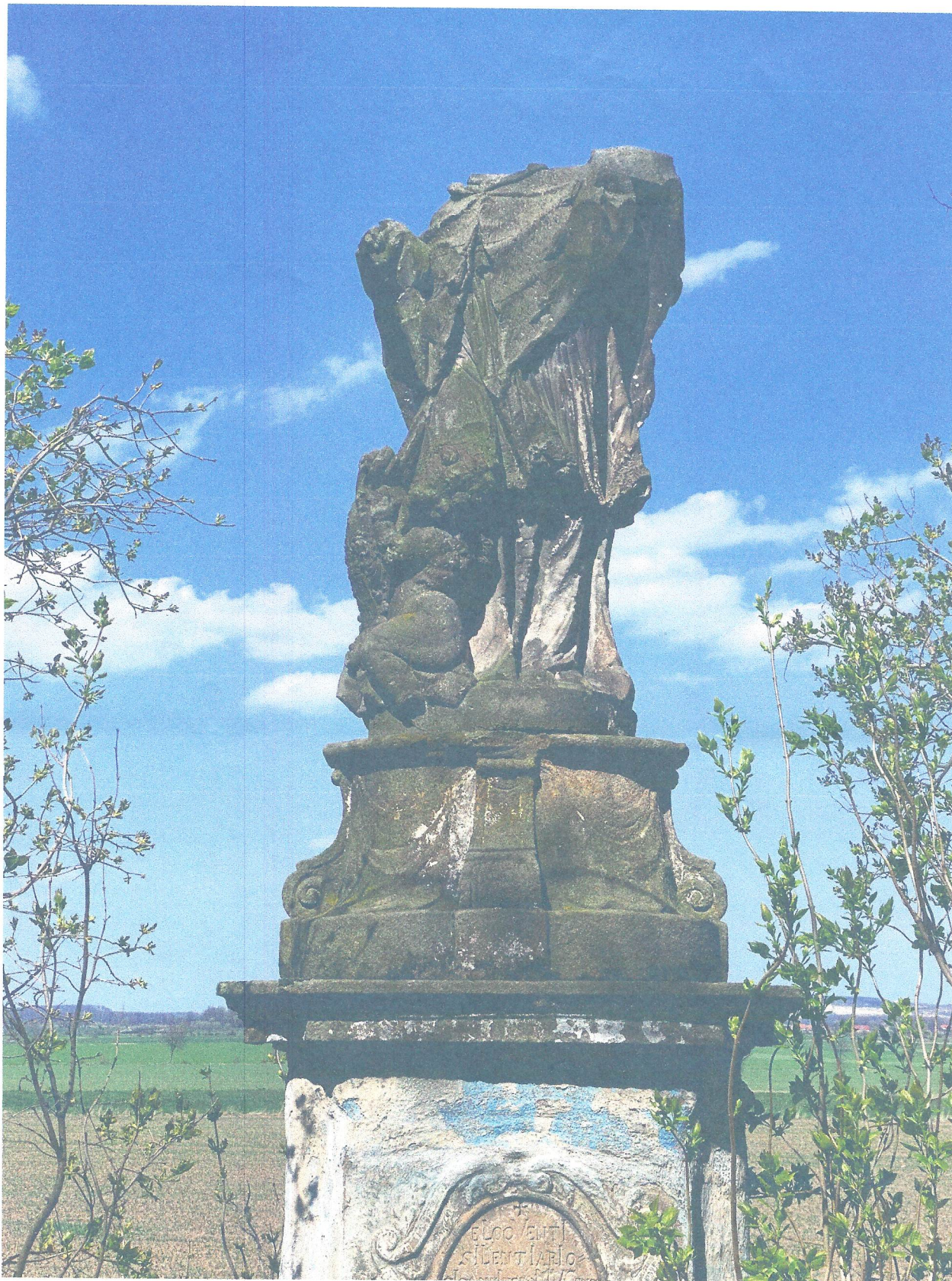
FOT. 4. FIGURA I PIASKOWCOWA PODSTAWA