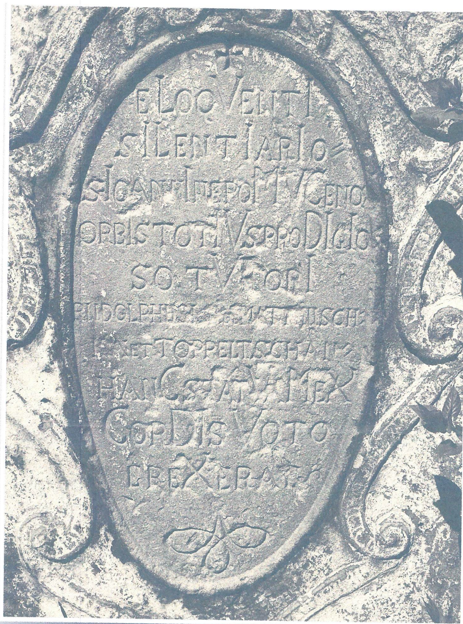
POMNIK ŚW. JANA NEPOMUCENA BRONÓW, GM. DOBROMIERZ, POW. ŚWIDNICKI

Załącznik nr..... do decyzji nr. 527/2021 z dnia 17.05.2021