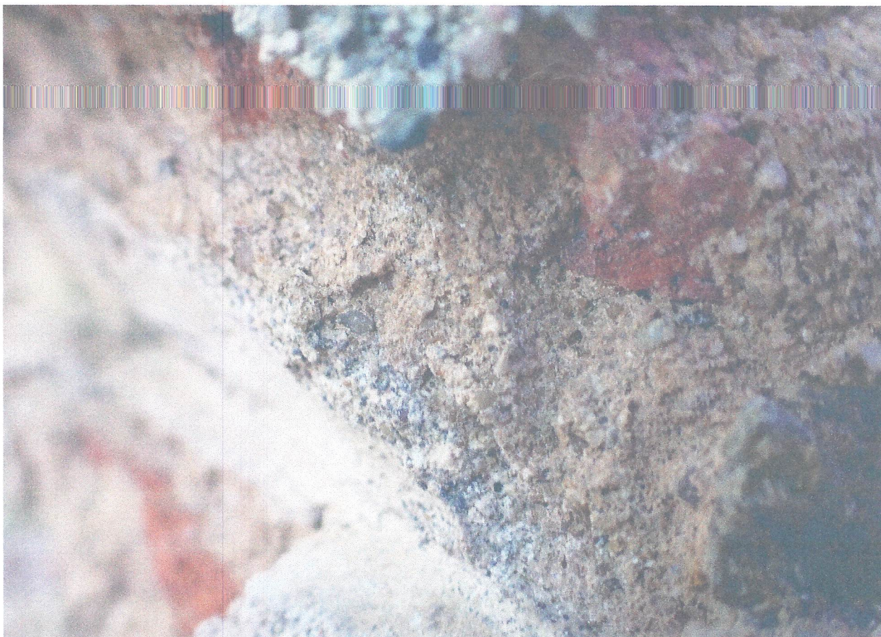
FOT. 10. NA PIERWOTNYM TYNKU WIDAĆ CIENKOWARSTWOWĄ NAPRAWĘ