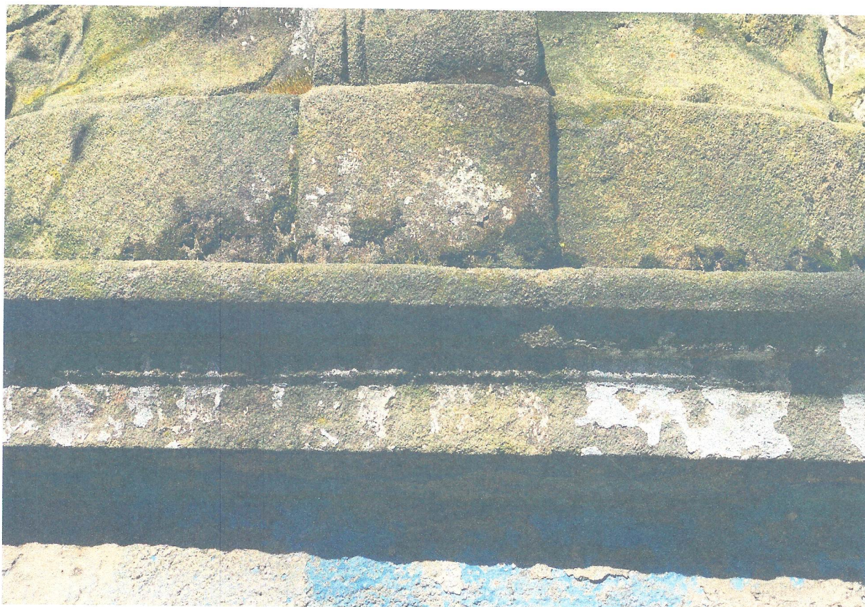
FOT. 6. ZNISZCZONA POWIERZCHNIA PIASKOWCA