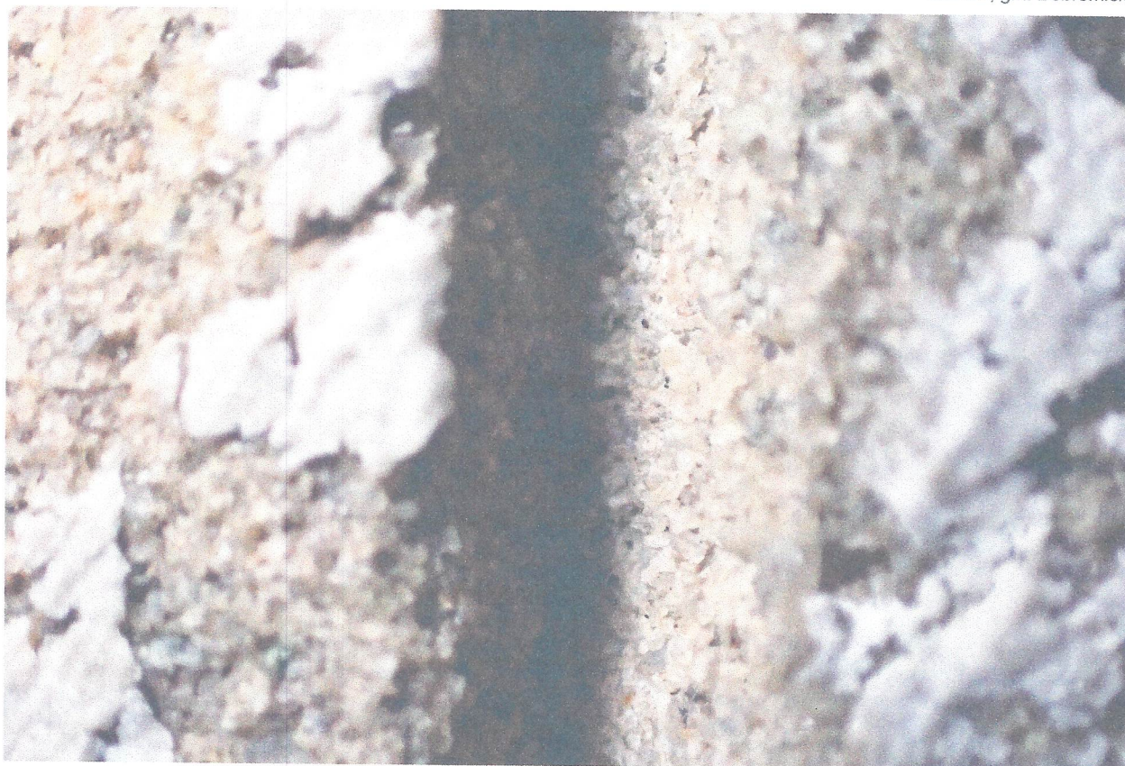
FOT. 12. WNĘTRZE LITERY Z TABLICY INSKRYPCYJNEJ