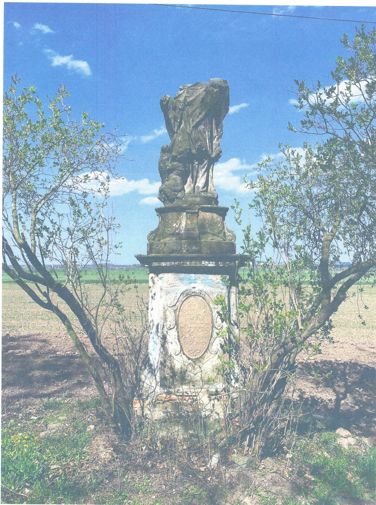
FOT. 1. OGÓLNY WIDOK POMNIKA Z PRZODU