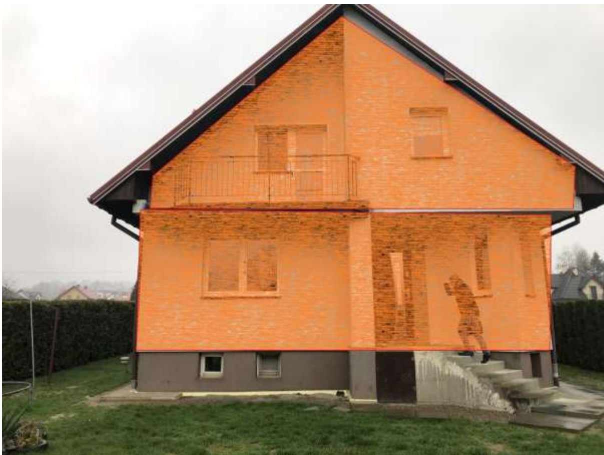
Rysunek 4 Zakres modernizacji – docieplenie ścian zewnętrznych