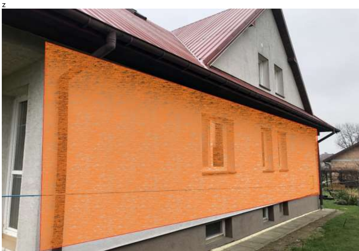
Rysunek 2 Zakres modernizacji – docieplenie ścian zewnętrznych