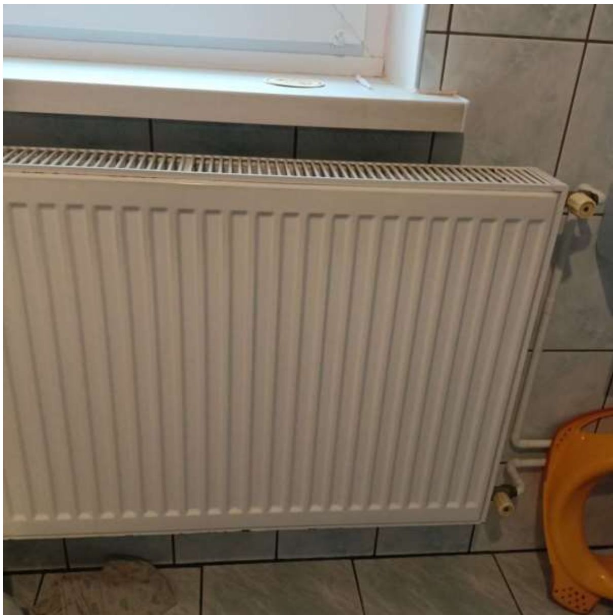
Rysunek 5 Zakres modernizacji instalacji co - montaż termostatów (3 szt.)