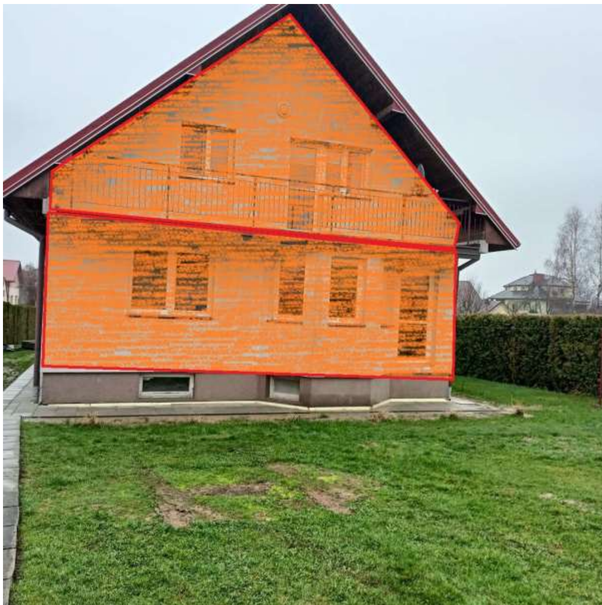
Rysunek 3 Zakres modernizacji – docieplenie ścian zewnętrznych