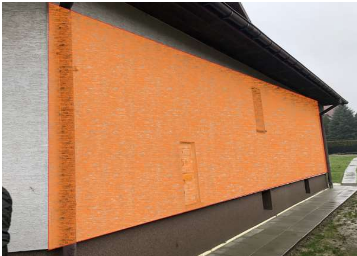
Rysunek 1 Zakres modernizacji – docieplenie ścian zewnętrznych