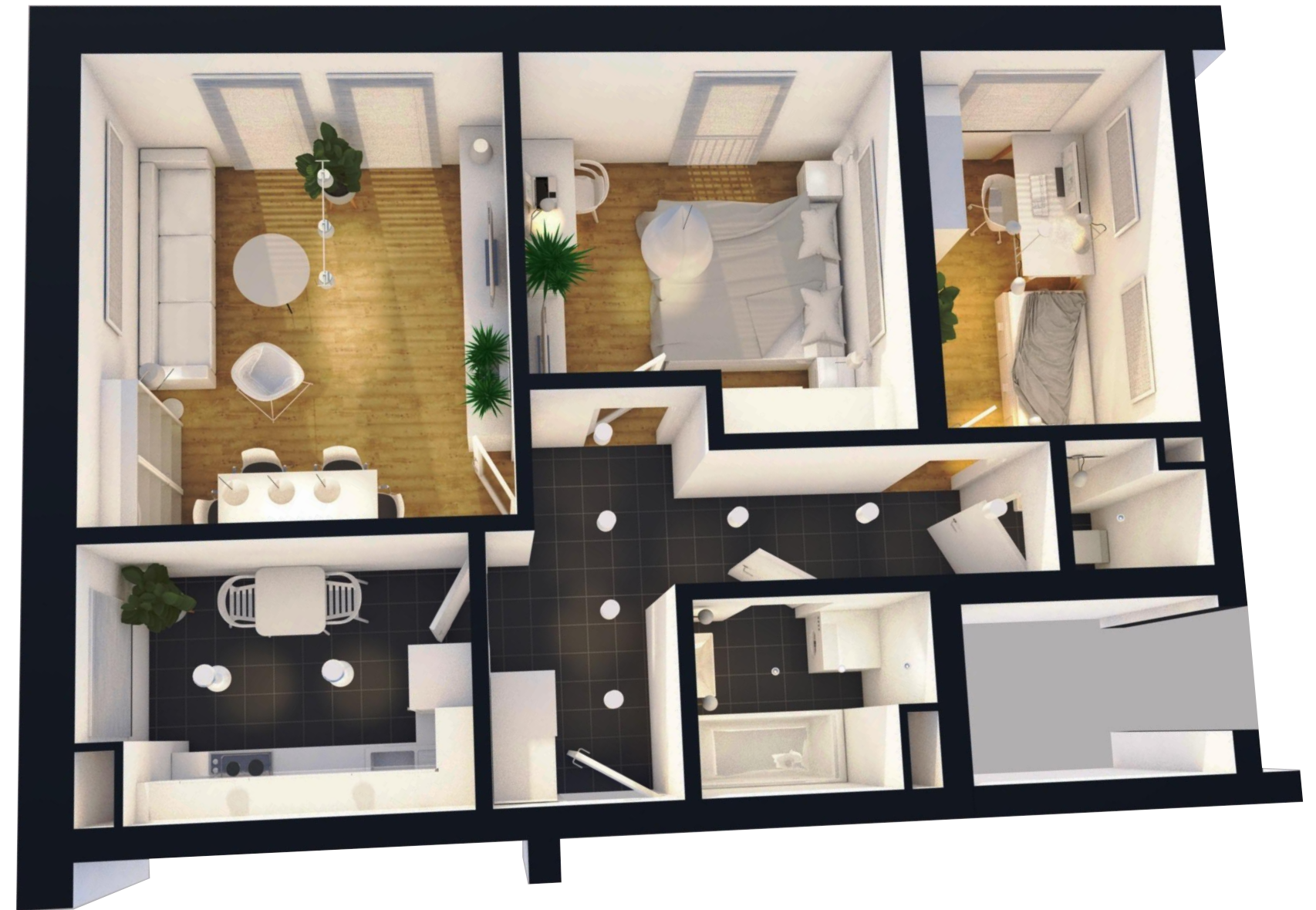
ZESTAWIENIE POWIERZCHNI UŻYTKOWEJ - MIESZKANIE NR 4,9,14