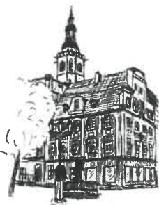
Rynek Wieża ratuszowa