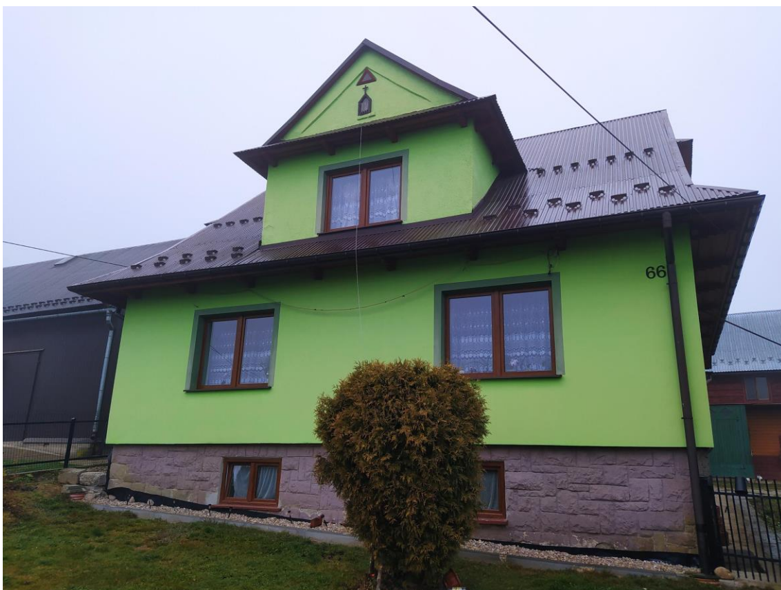
widok od strony S