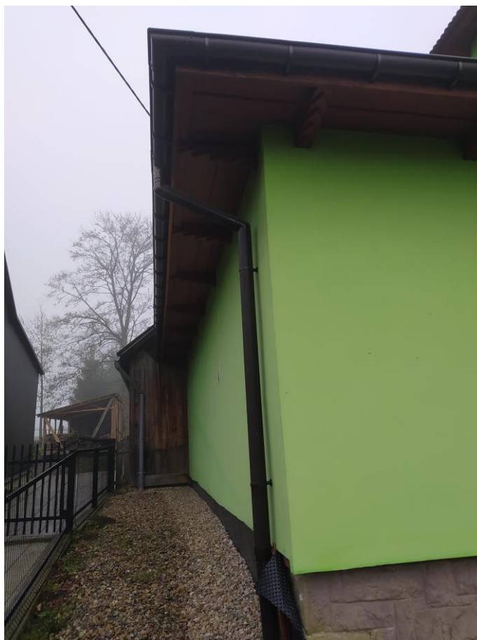
widok od strony W