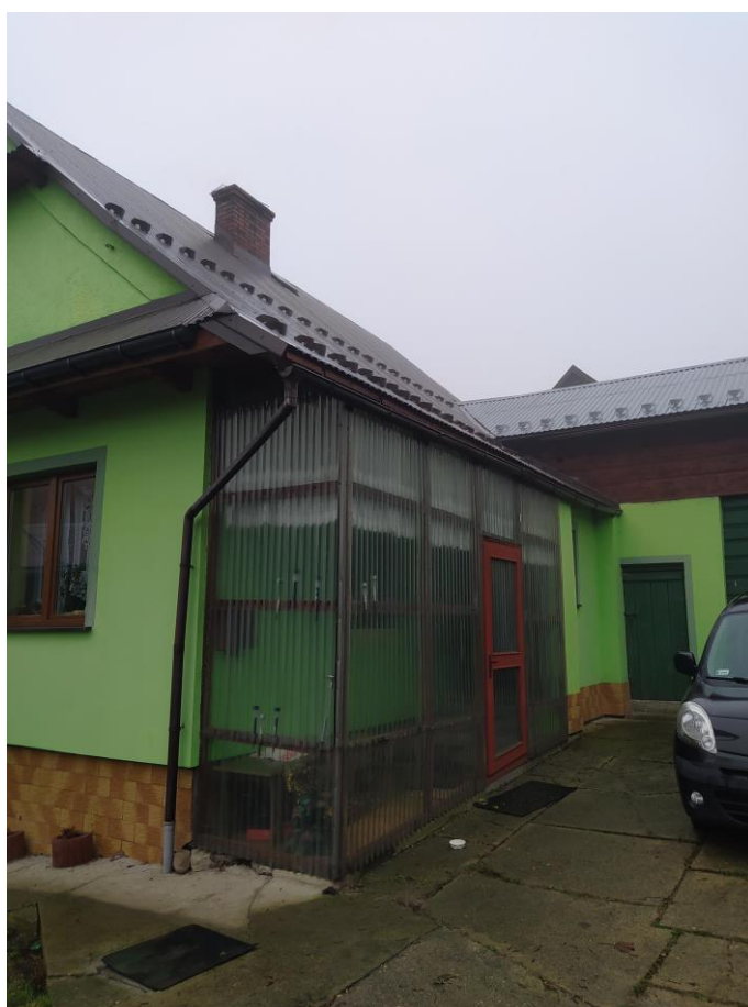
widok od strony N