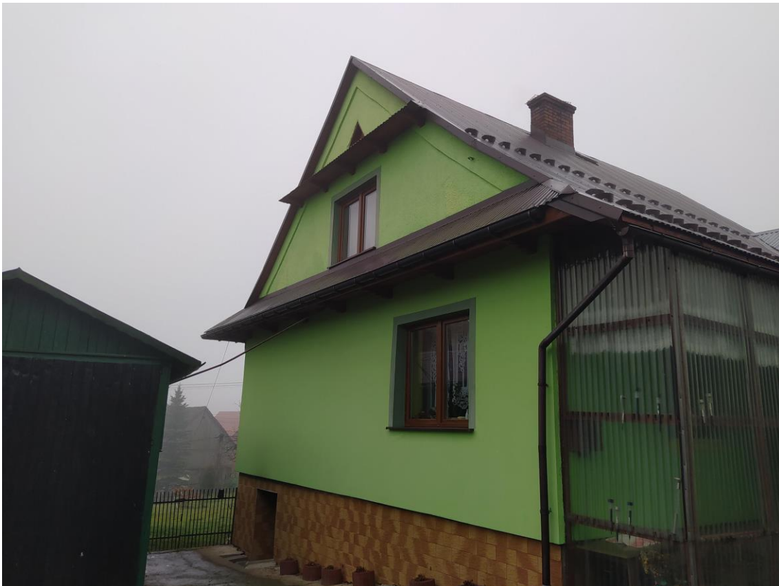
widok od strony E