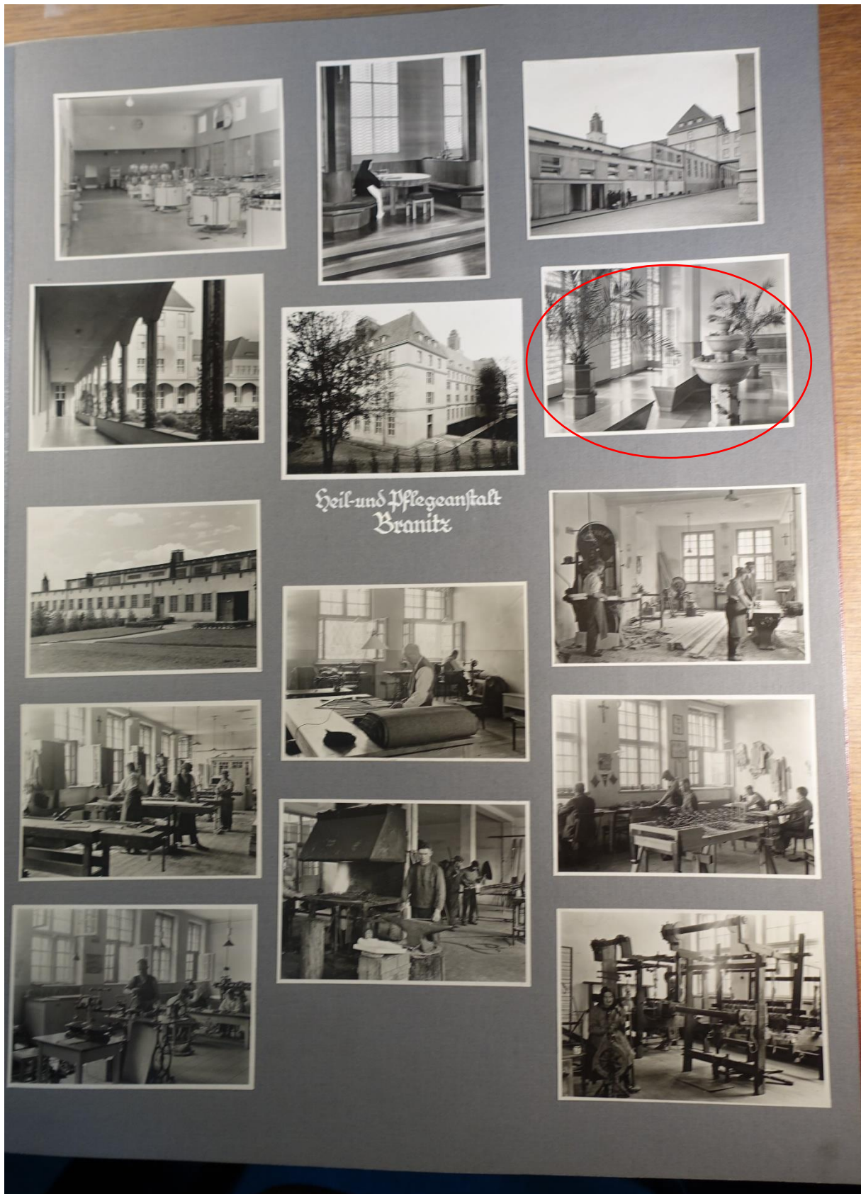
Fot. 2 Fotografie budynków i ich wnętrz należących do parafii branickiej.