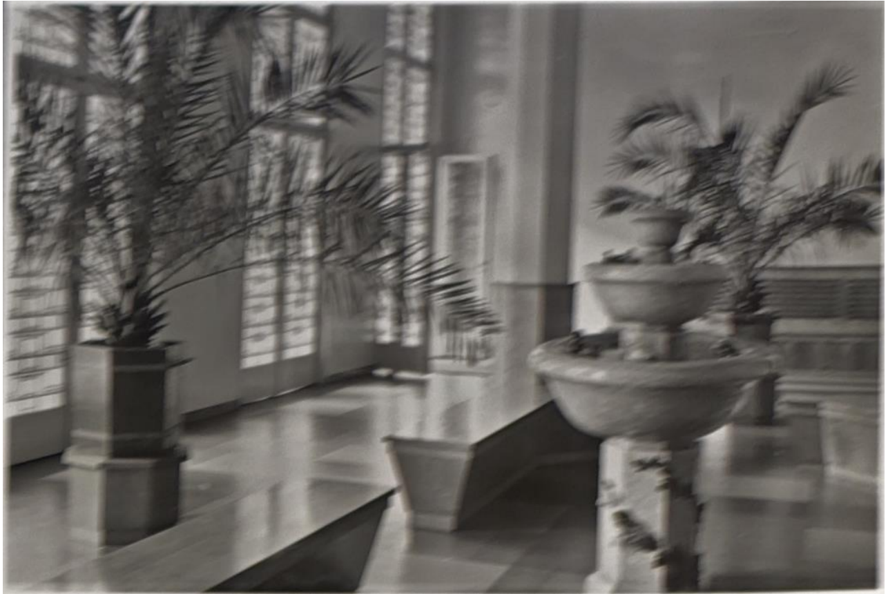
Fot. 3 Wnętrze holu dawnego klasztoru.

Strona główna > Linoleum > VENETO xf 2 ™ (2,5 mm) > Veneto HORIZON 663