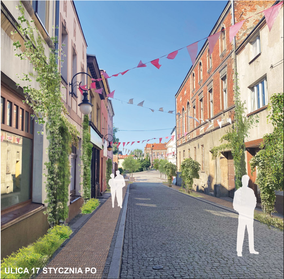
ULICA 17 STYCZNIA PO