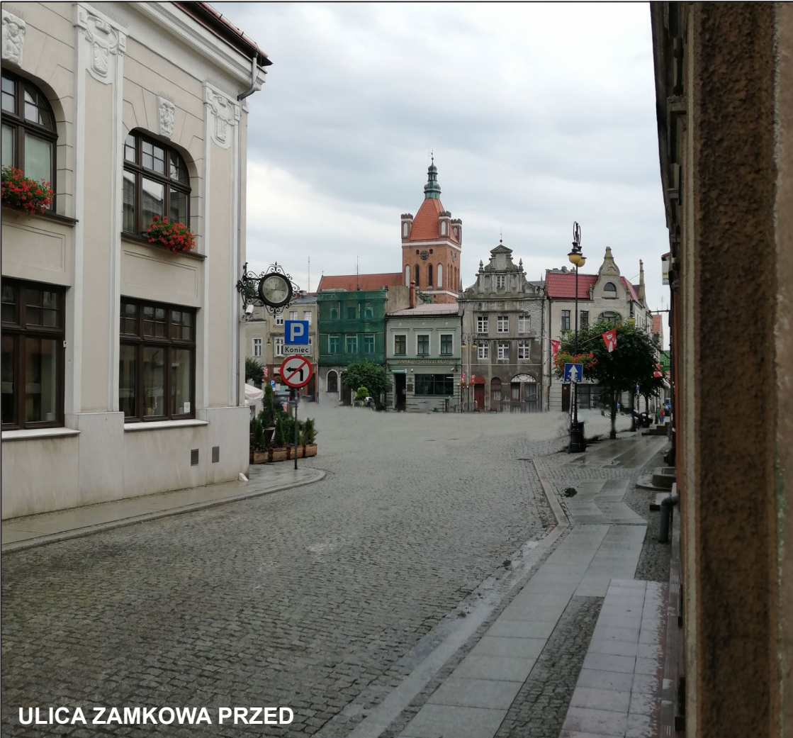
ULICA ZAMKOWA PRZED