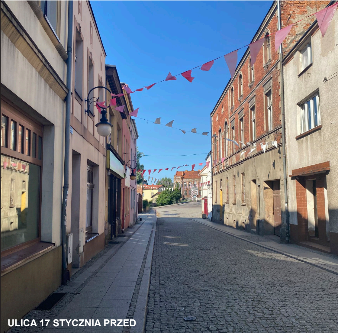
ULICA 17 STYCZNIA PRZED