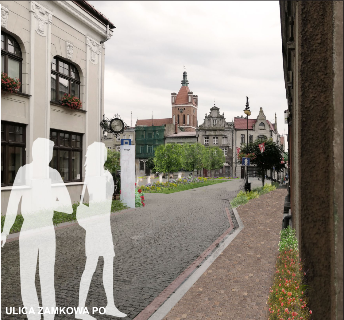
ULICA ZAMKOWA PO