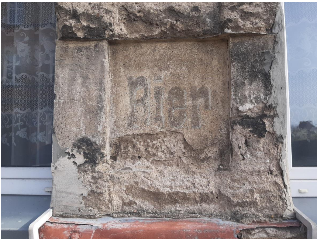
Fot.8. Zbliżenie na fragment z napisem Bier i częściowy ubytek tynku poniżej. Stan zachowania w kwietniu 2024r. (autor fot.: L. Piotrowska-Cześnik).