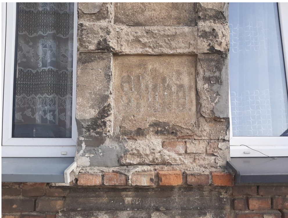
Fot.9. Zachowany napis w j. niemieckim Stube. Oznaczający ławę/handlową. Stan zachowania w kwietniu 2024r.