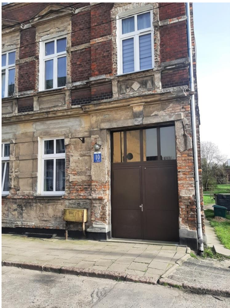
Fot.3. Brama wejściowa do kamienicy przy ul. Młyńskiej 10 w Stargardzie, kwiecień 2024r.