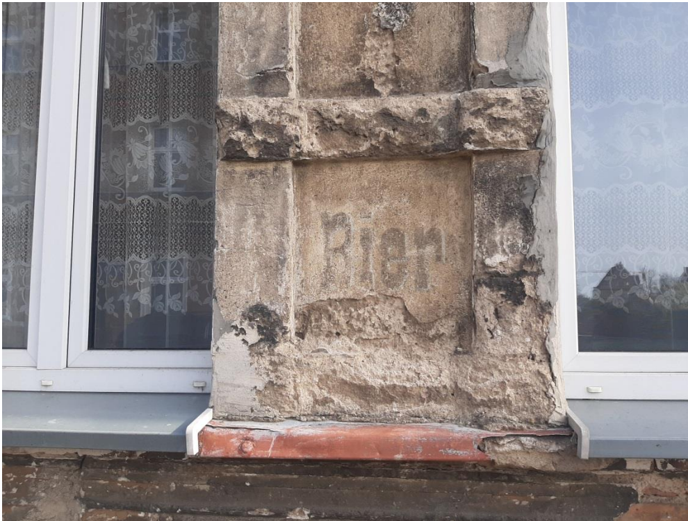
Fot.7. Napis w j. niemieckim BIER czyli piwo. Stan w kwietniu 2024r.

krzemoorganicznego. Zazwyczaj minimum tydzień do 4 tygodni w celu odparowania rozpuszczalników i utwardzeniu żywicy.