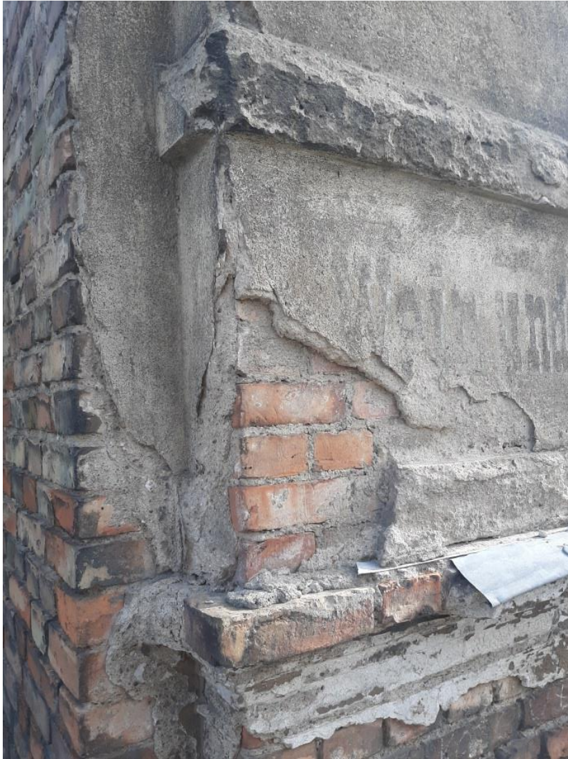
Foto. 5. Narożnik po lewej stronie elewacji kamienicy przy ul. Młyńskiej 10 w Stargardzie. Widoczny ubytek tynku aż do powierzchni ceglanego muru. Niezbędne jest uzupełnienie ubytków tynku zaprawą mineralną o podobnym składzie i parametrach. Liternictwo czytelne i zachowane. Stan zachowania w kwietniu 2024r..