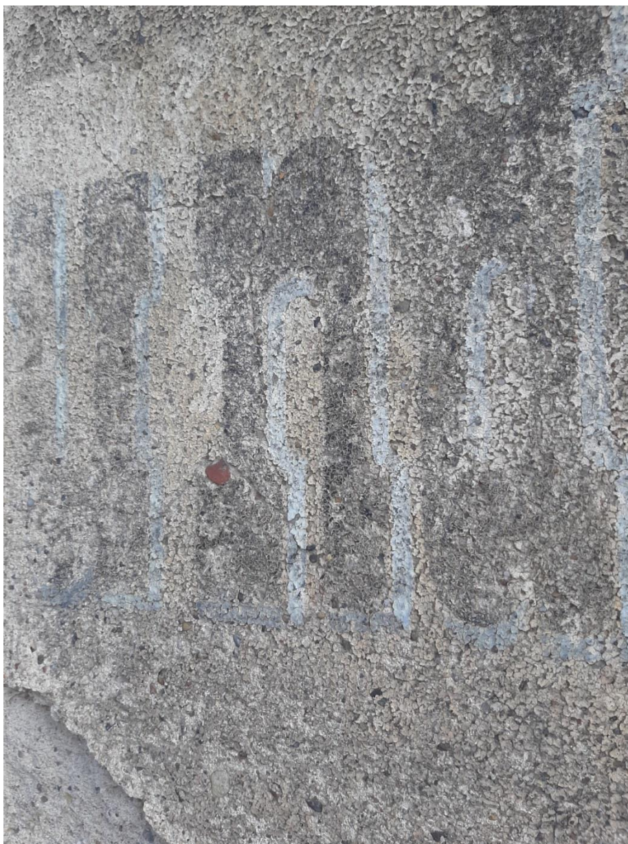
Foto. 6. Zbliżenie na zachowany fragment liternictwa przedwojennej reklamy. Tynk jest mineralny wapienno-piaskowy. Zachowane warstwy barwne porównano z wzornikiem barwnym farb firmy KEIM-PALETTE exclusiv Keim farben. Kolor tła jest jasny w ciepłym odcieniu ugowym. Główne litery są w kolorze ciemnym szarym, natomiast zaakcentowane są kolorem jasnym rozbielonym błękitnym. Oczywiście obecnie po ok. 100 latach od czasu powstania wszystko jest wypłowiałe od słońca, przypatynowane kurzem i spękane z widoczną siatką tych spękań.

Stan zachowania tynków na trzech polach pomiędzy oknami na parterze kamienicy po lewej stronie, tam gdzie jest zachowany napis przedwojennej reklamy jest słaby, kruszy się przy dotknięciu palcem. Wymaga wykonania wzmocnienia strukturalnego odpowiednim preparatem krzemooorganicznym np. firmy Remmers, preparat KSE 100 lub KSE 300 . Wzmocnienie należy wykonać wcześniej nim przystąpi się do konserwacji malowanego napisu, tak aby zachowany tynk uległ wzmocnieniu i utwardzeniu pod wpływem preparatu