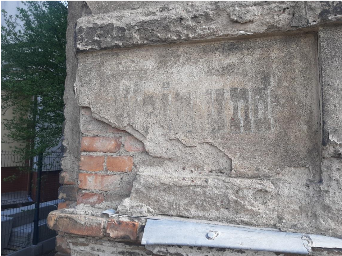
Foto.4. Lewa strona elewacji frontowej kamienicy przy ul. Młyńskiej 10 w Stargardzie. Czytelne zachowane liternictwo przedwojennej reklamy. Tu zachowane słowa w j. niemieckim : „ Wein und „....., widoczny częściowy ubytek tynku głęboki do powierzchni ceglanego muru. Stan w kwietniu 2024r. (autor fot.: L. Piotrowska-Cześnik).

Na kilku fotografiach poniżej pokazano stan zachowania malowanych na tynku liter na kolejnych trzech polach pomiędzy oknami parteru kamienicy, kolejno od lewej strony do prawej.