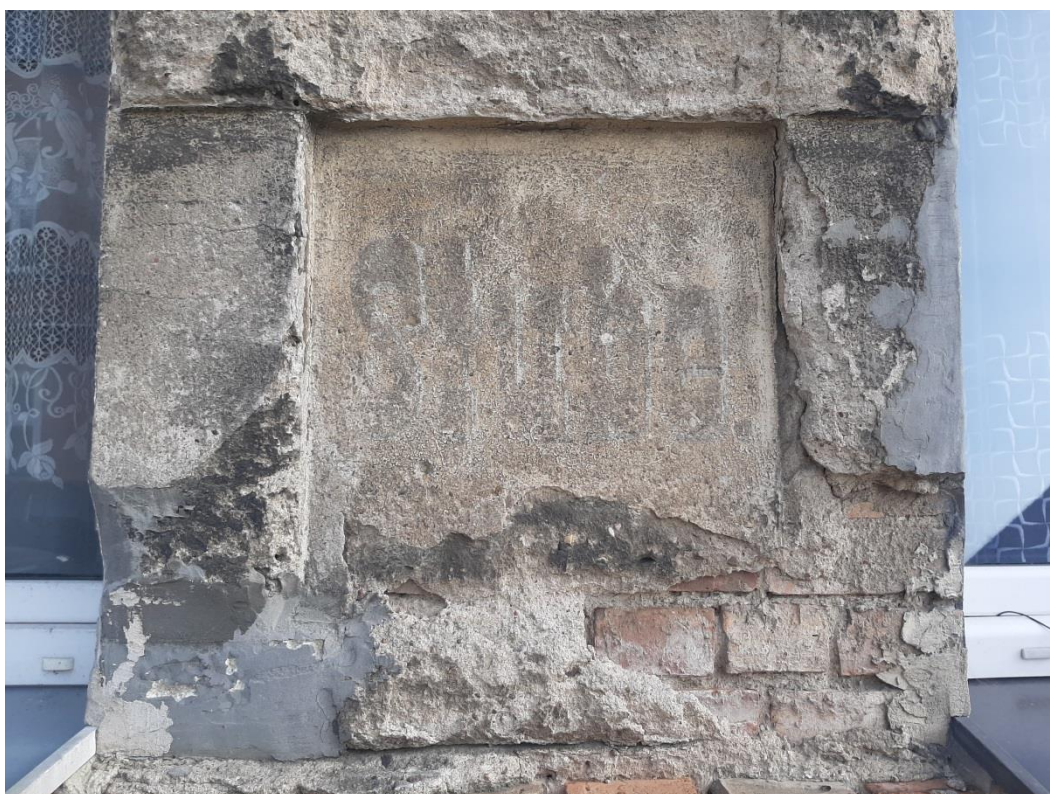
Fot.10. Zbliżenie na pole między oknami z zachowanym malowanym napisem Stube .