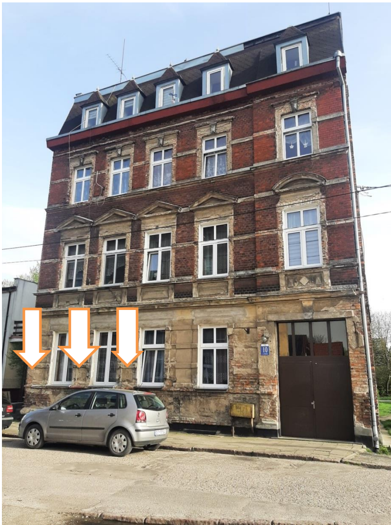
Fot.2. Elewacja kamienicy mieszkalnej przy ul. Młyńskiej 10 w Stargardzie, gdzie zachowała się przedwojenna reklama na wysokości okien parteru, malowana na tynkach w polach pomiędzy oknami, po lewej stronie. Strzałkami zaznaczono miejsca zachowanego napisu o treści : „Wein und” „Bier” „Stube”. Zachowały się łącznie trzy powierzchnie z malowanym napisem. Stan w kwietniu 2024r.

Kamienica mieszkalna przy ul. Młyńskiej 10 w Stargardzie, gdzie na elewacji frontowej zachowana jest malowana na tynku przedwojenna reklama o treści : „ Wein und” „ Bier” „Stube.” Kamienica postawiona z murów ceglanych, tynkowana z dekoracjami sztukatorskimi. Czas powstania: XIX w. Materiał : ściany murowane z cegły ceramicznej; tynki elewacyjne mineralne wapienno-piaskowe, litery reklamy przedwojennej malowane farbami elewacyjnymi w kolorze ciemnoszarym i podkreślone bardzo jasnym rozbielonym błękitem, tło w odcieniu ciepłego koloru ugrowego; powierzchnia liter delikatnie spękana. Autor malowanej reklamy nie jest nieznan.