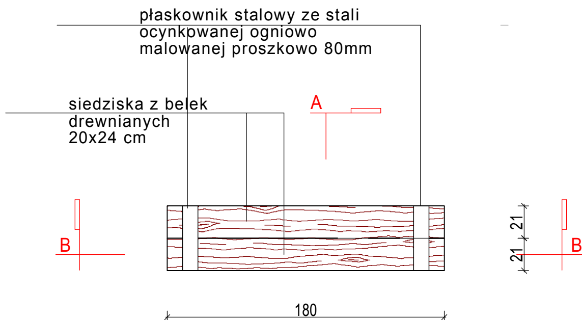
WIDOK Z GORY