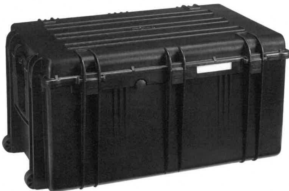
Rysunek nr 1