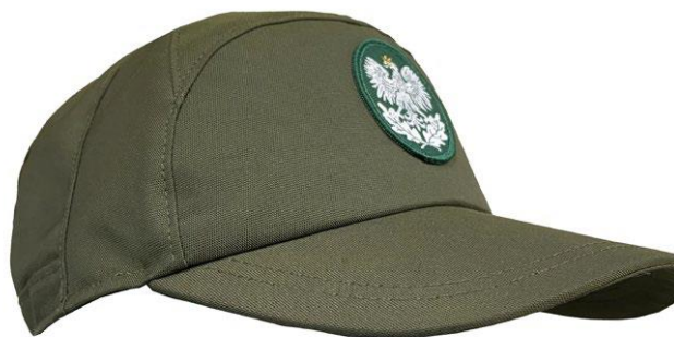
Czapka przeciwdeszczowa z daszkiem