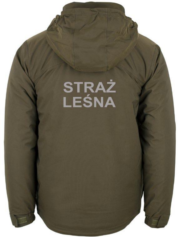
Kurtka ocieplana z podpinką