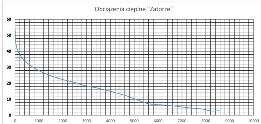
Rys. Uporządkowany wykres obciążeń cieplnych dla 2020r.

Rzeczywiste średniogodzinowe maksymalne zapotrzebowanie mocy zarejestrowane w latach 2017-2020 (archiwizacja danych) wyniosły ok. 56 MW przy mocy zamówionej na poziomie 69,7 MW. Uporządkowany wykres obciążeń cieplnych kotłowni „Zatorze” dla roku 2020 zamieszczono poniżej.