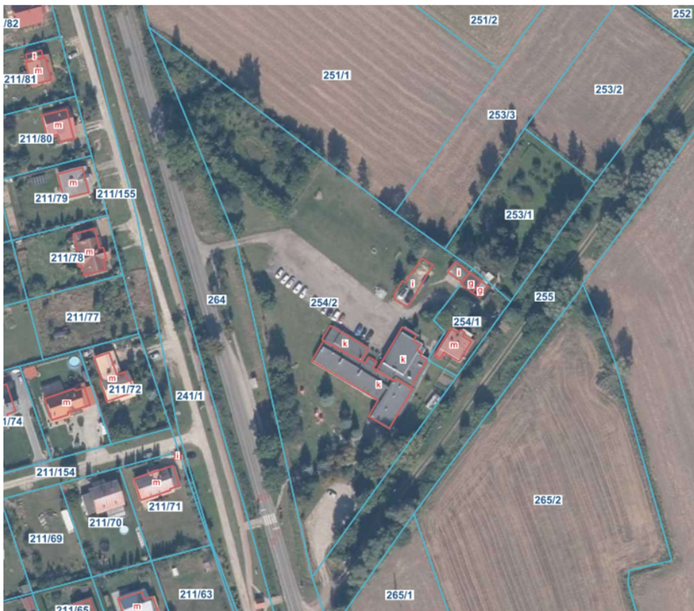
Rys. nr 1 – Istniejące zagospodarowanie terenu działki nr 254/2

Budynek Zespołu Szkolno-Przedszkolnego w Grabinach-Zameczku zlokalizowany jest na dz. nr 254/2, obręb Grabiny Zameczek. łączna powierzchnia zabudowy zespołu szkolno-przedszkolnego to 1.0921 ha. Powierzchnia zabudowy budynku szkoły to 879 m 2 .