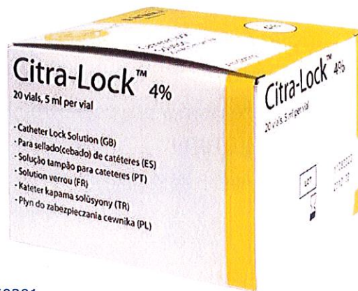
Pudełka zawierają 20 fiolek po 5 ml