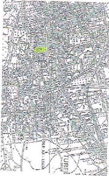
Orientacja 1: 25 000

skala mapy 1:500 godło mapy : 6.168.25.02.1.4 oznaczenie kancelaryjne zgłoszenia pracy geodezyjnej GEO.6640.1788.2015 nazwa miejscowości: Turek jednostka ewidencyjna: 302701_1 Turek obchód ewidencyjny : 302701_1.0001 A nazwa układu współrzędnych : 2000/6 wysokości : Kronsztadt 60 oznaczenie granic obszaru, który był przedmiotem aktualizacji data opracowania mapy : 21.09.2015 r. Mapa do celów projektowych została wykonana bez ustalenia obciążeń służebnościami gruntowymi ujętymi w księgach wieczystych