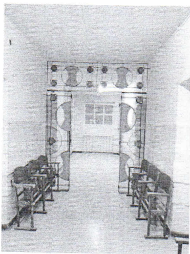
Zdjęcie 11. II piętro – element dekoracyjny (metaloplastyka) w komunikacji ogólnej (pom. 2.01).