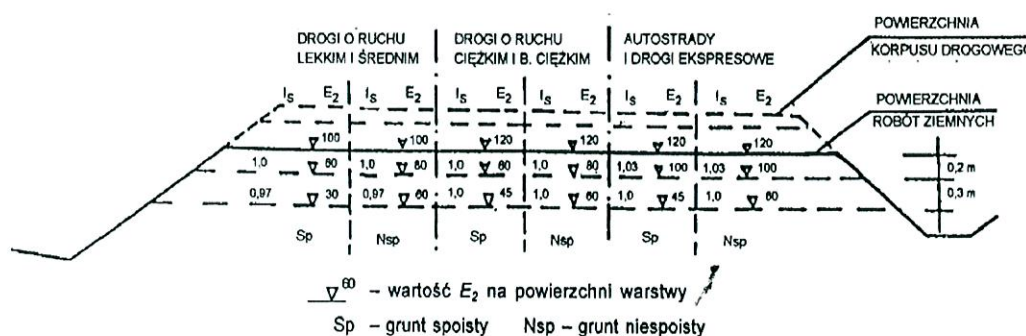
Rys. 1 Wartości wymagane w podłożu wykopów: wskaźnika zagęszczenia I_s i wtórnego modulu odkształcenia E_2 [MPa]

Grunt należy zagęszczać warstwami gr. 20cm. Wskaźnik zagęszczenia I_s gruntu dla każdej warstwy grubości 20cm powinien osiągnąć wartości podane na rysunku 1.