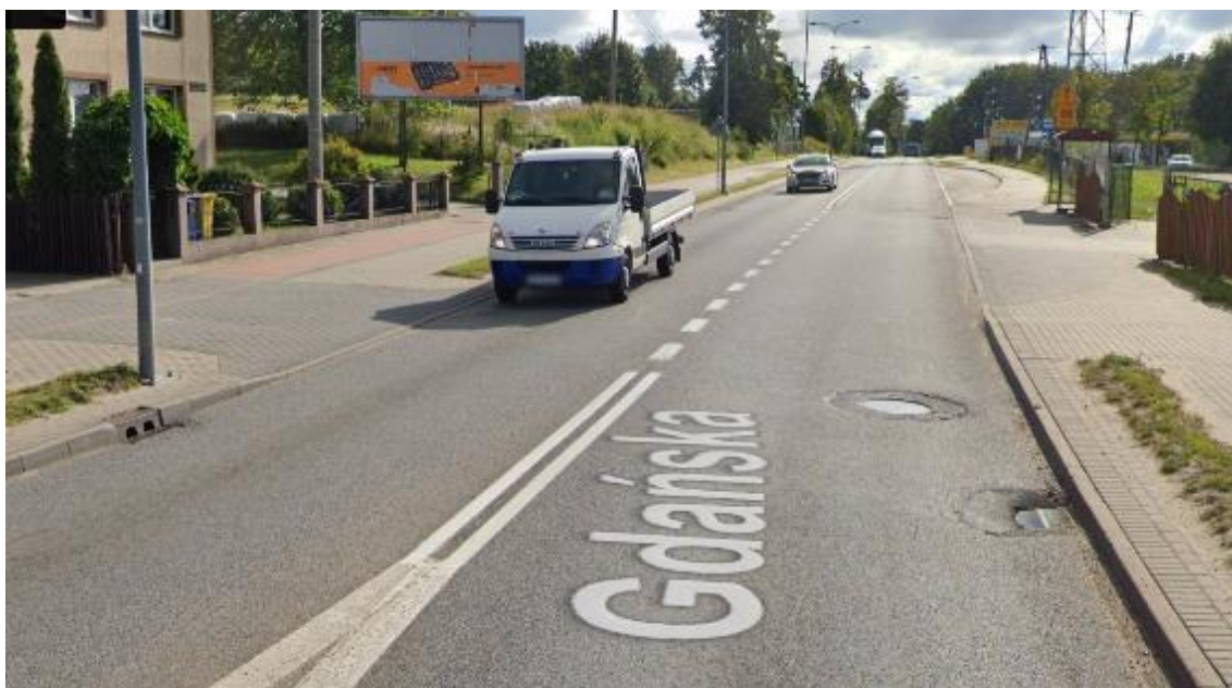
Rysunek 4. Widok drogi DW221