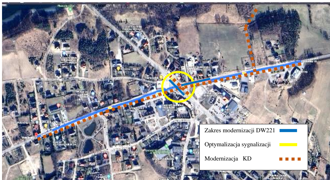
Rysunek 2. Miejsce inwestycji