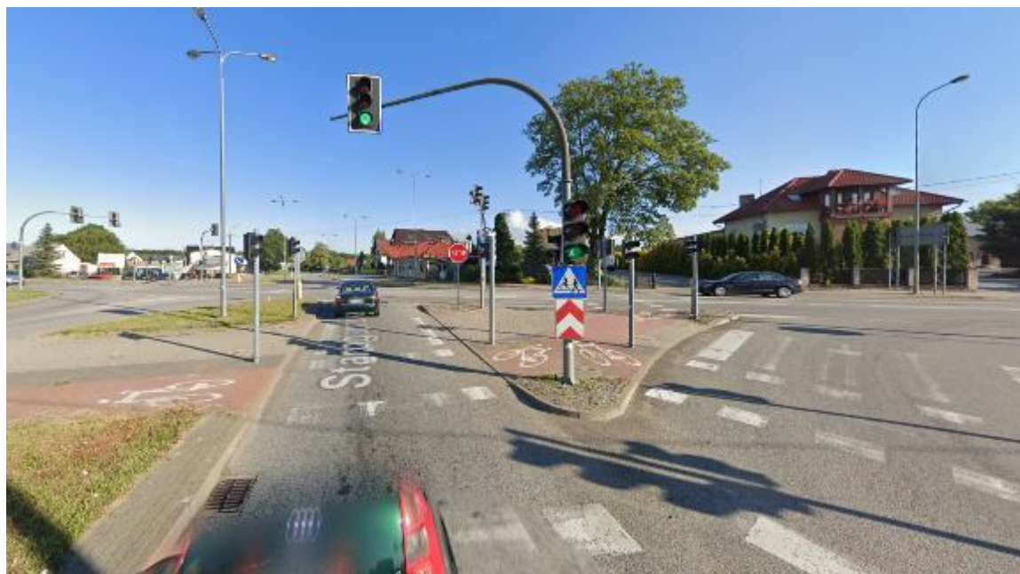
Rysunek 5. Widok skrzyżowania z DW224