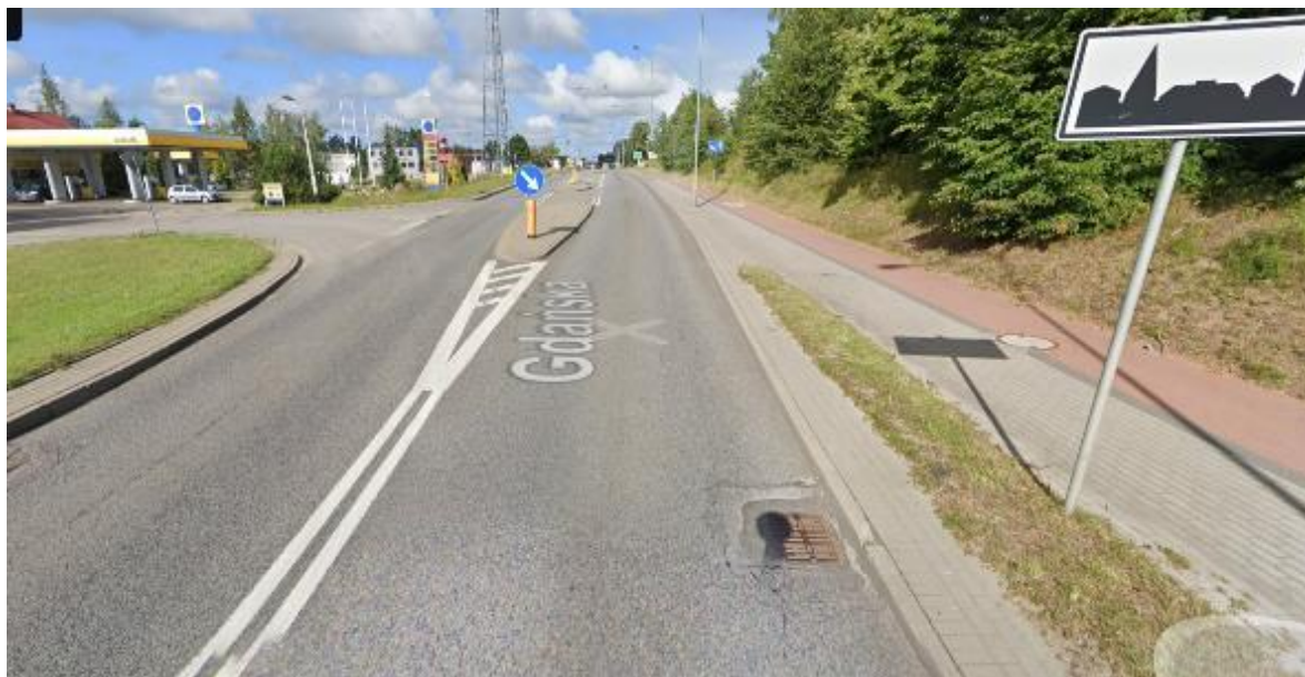
Rysunek 3. Widok drogi DW221

Jednocześnie planowana jest rozbudowa drogi na odcinku na dojazdach do granicy Nowej Karczmy z kierunku Kościerzyny oraz Przywidza. Inwestycje te przewidują podniesienie nośności nawierzchni do 115kN/oś oraz konstrukcję dla ruchu KR4.