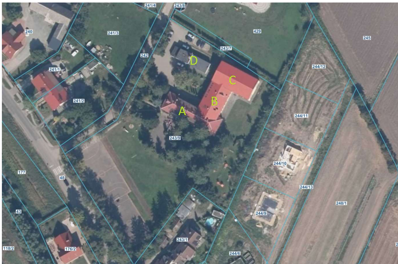
Rys. nr 1 – Istniejące zagospodarowanie terenu działki nr 243/9

Kompleks szkolny składa się z czterech części: