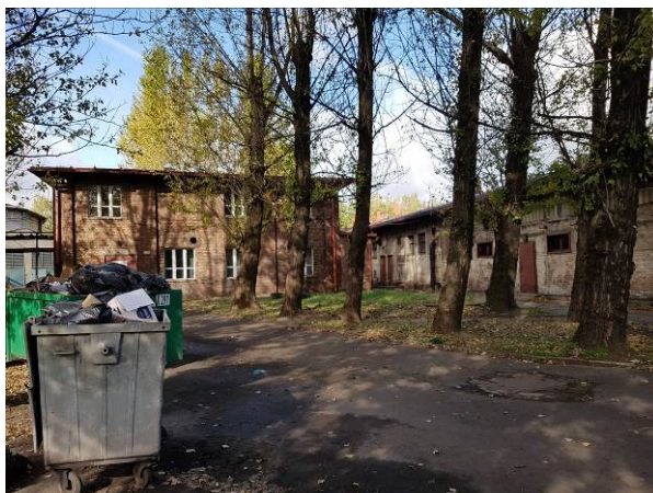
Rys. 6 Budynek laboratorium Szybu „Poniatowski” w Katowicach

Źródło: materiały własne KZGM w Katowicach.