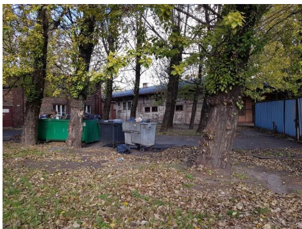
Rys. 7 Budynek łaźni i lampowni Szybu „Poniatowski” w Katowicach