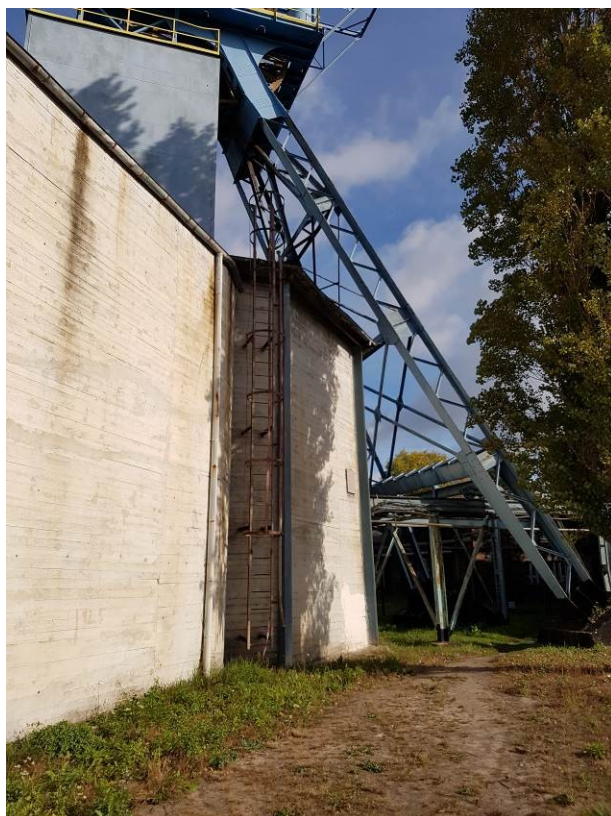
Rys. 4 Budynek szybowy Szybu „Poniatowski” w Katowicach