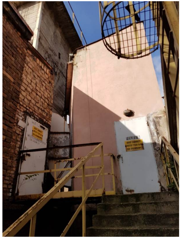
Rys. 5 Budynki wentylatorów Szybu „Poniatowski” w Katowicach