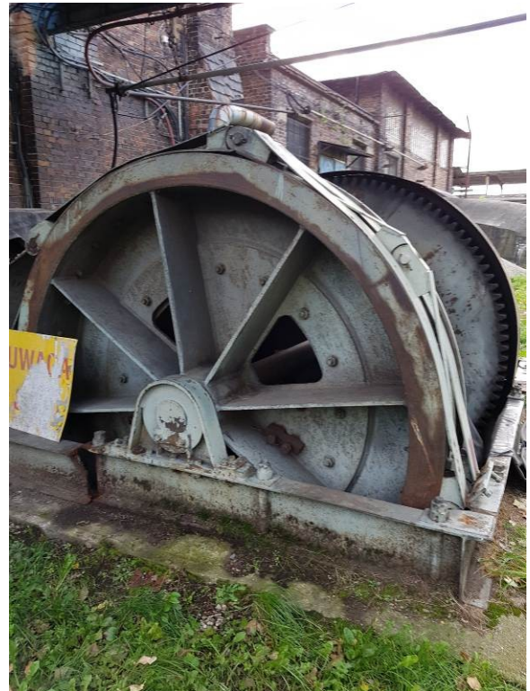
Rys. 3 Budynek maszyny wyciągowej Szybu „Poniatowski” w Katowicach