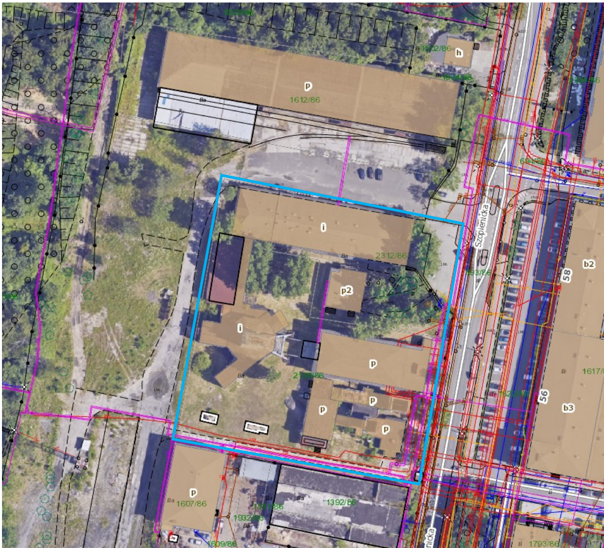
Rys. 2 Mapa zasadnicza obrazująca zakres terenu nieruchomości przy ul. Szopienickiej w Katowicach (Szyb „Poniatowski”)