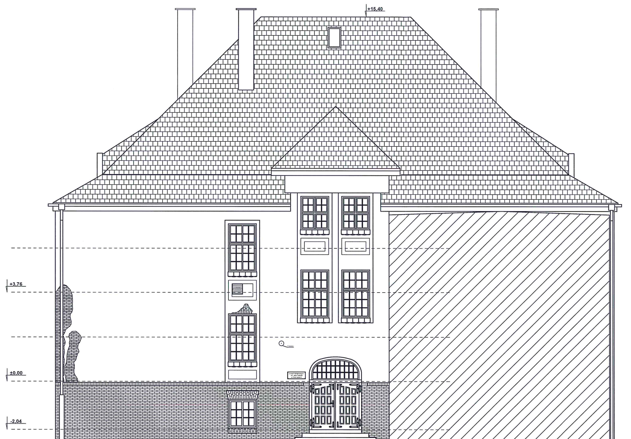
ELEWACJA TYLNA- WSCHODNIA

STAROSTA STAROGARDZKI 83-200 Starogard Gdański ul. Kościuszki 17 (11)