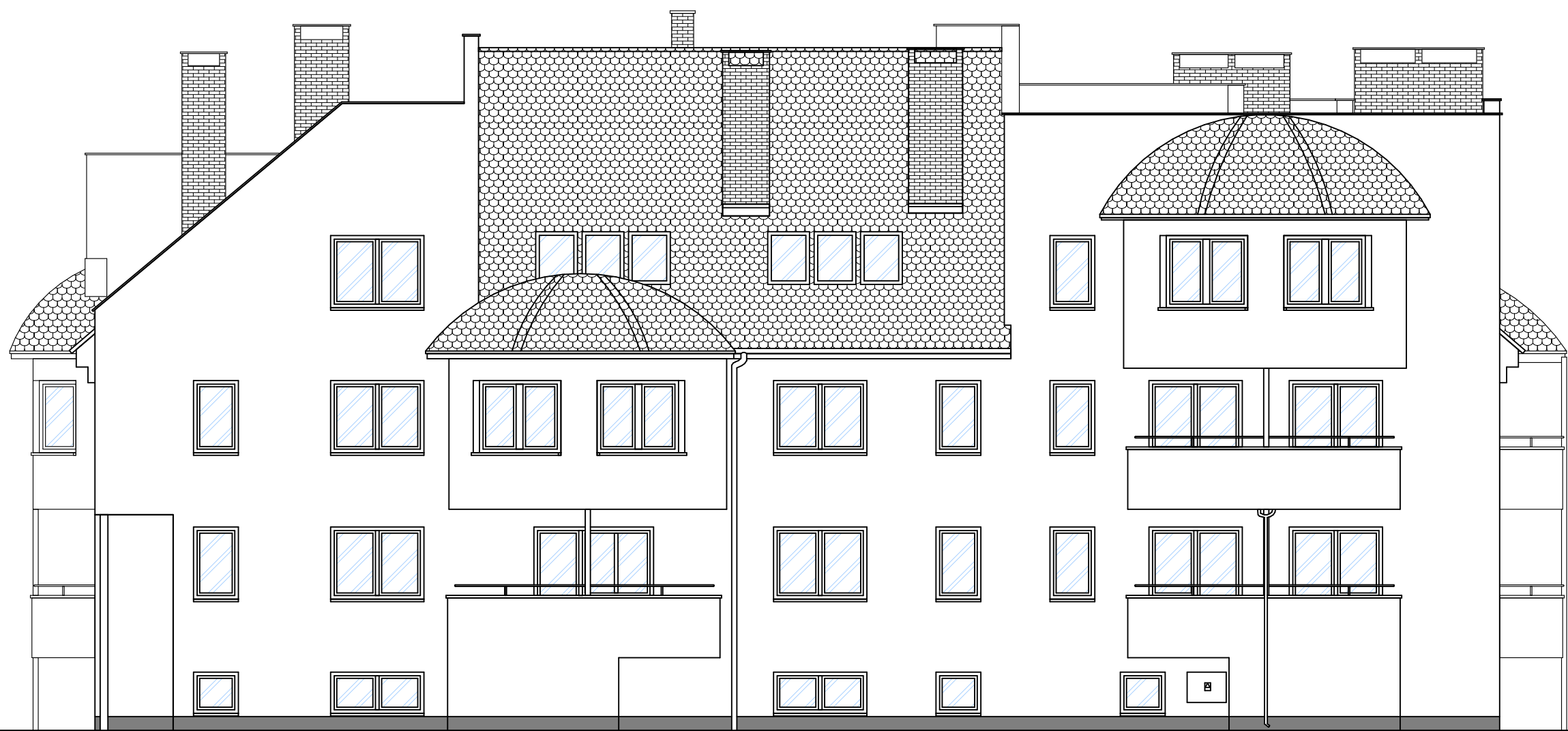
ELEWACJA WSCHODNIA - INWENTARYZACJA