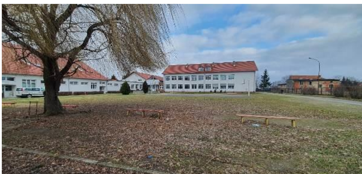
Budowa boiska wielofunkcyjnego wraz z zadaszaniem o stałej konstrukcji przy Szkole Podstawowej w Udaninie