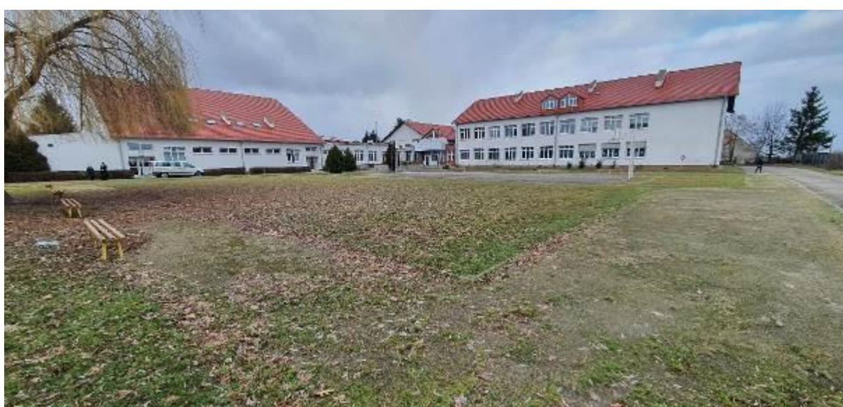
Budowa boiska wielofunkcyjnego wraz z zadaniem o stałej konstrukcji przy Szkole Podstawowej w Udaniu