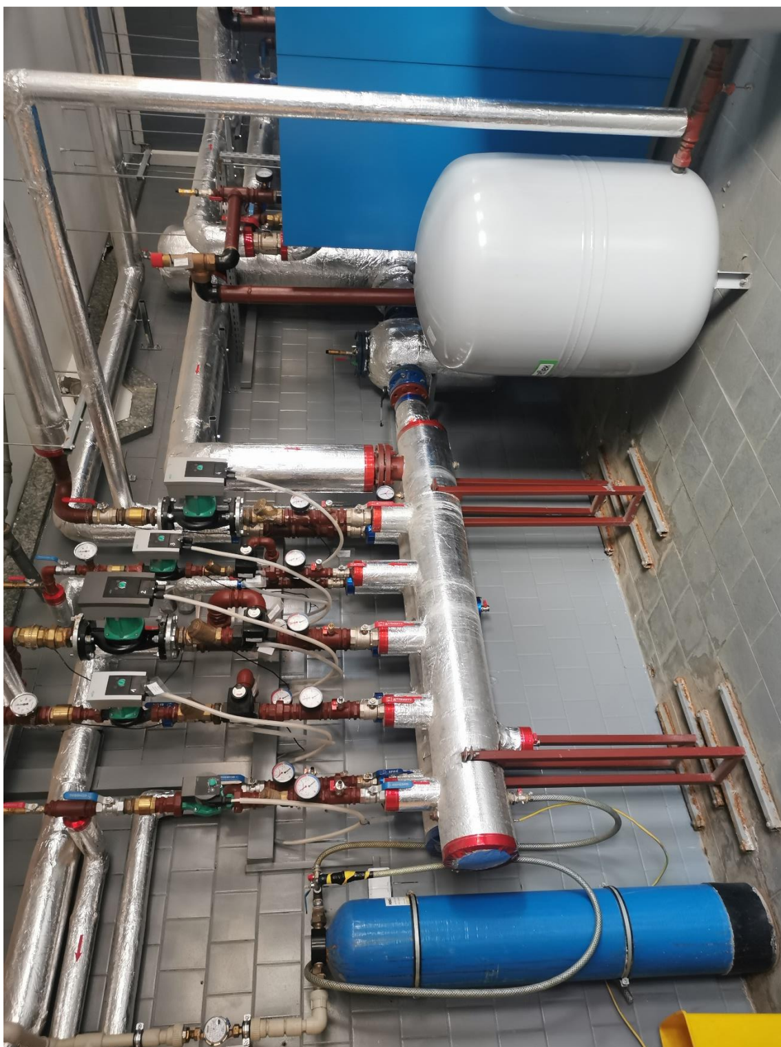
Zdjęcie 4. Widok na istniejący rozdzielacz obiegów grzewczych i urządzenia pomocnicze