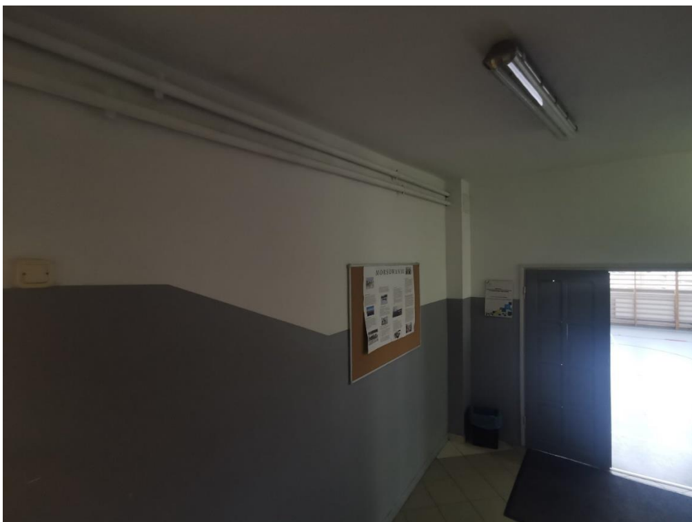
Zdjęcie 10. Miejsce połączenia z istniejącą instalacją dla sali gimnastycznej

W segmencie D, bezpośrednio w obrębie sali gimnastycznej pom. D0.02 nie projektuje się nowej instalacji centralnego ogrzewania. W ramach niniejszej dokumentacji należy przełączyć tą instalację w miejscu widocznym na powyższym zdjęciu w zabudowanym szachcie.