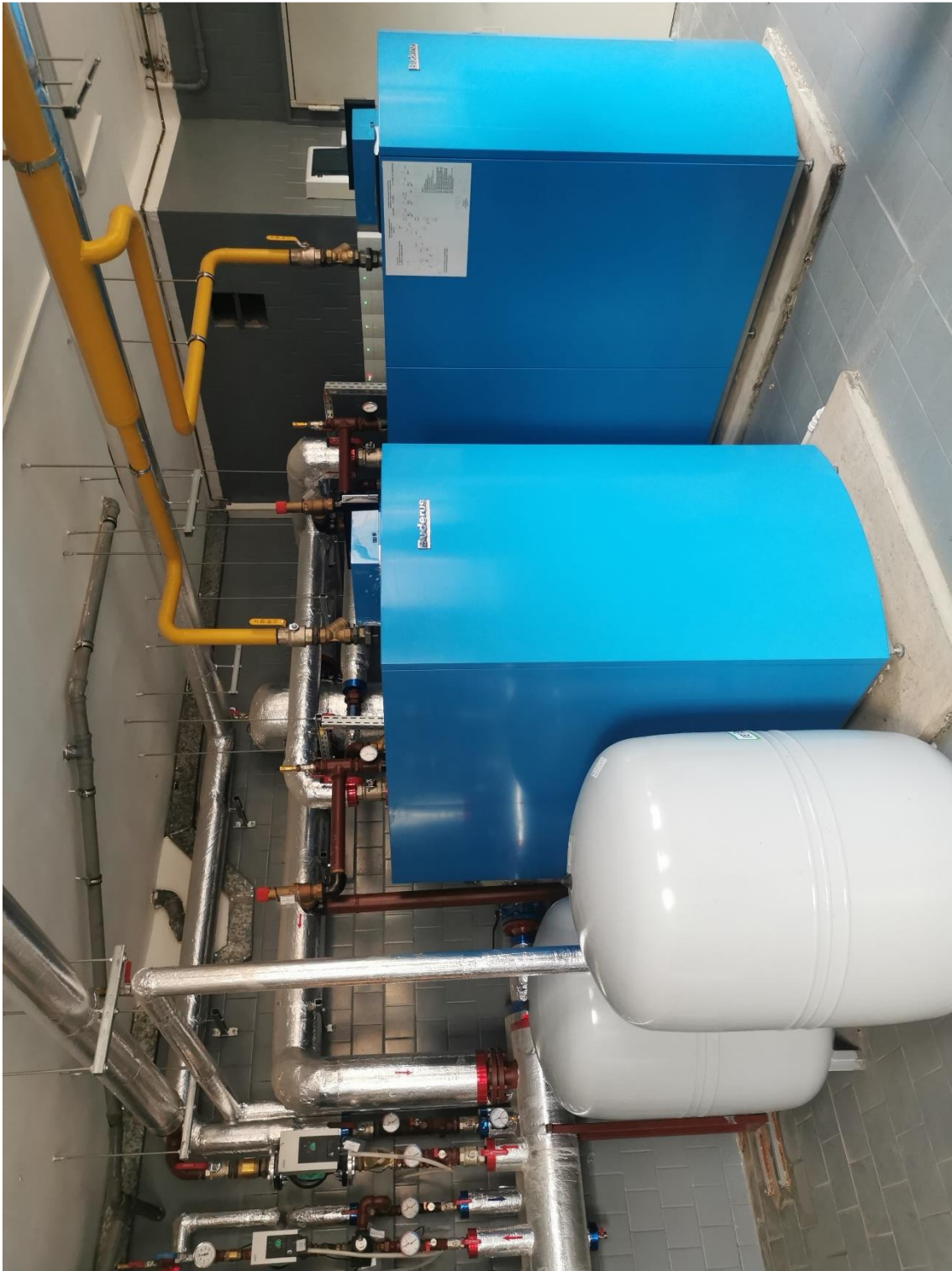
Zdjęcie 2. Widok na istniejący układ kotłowy wraz z zasileniem rozdzielacza