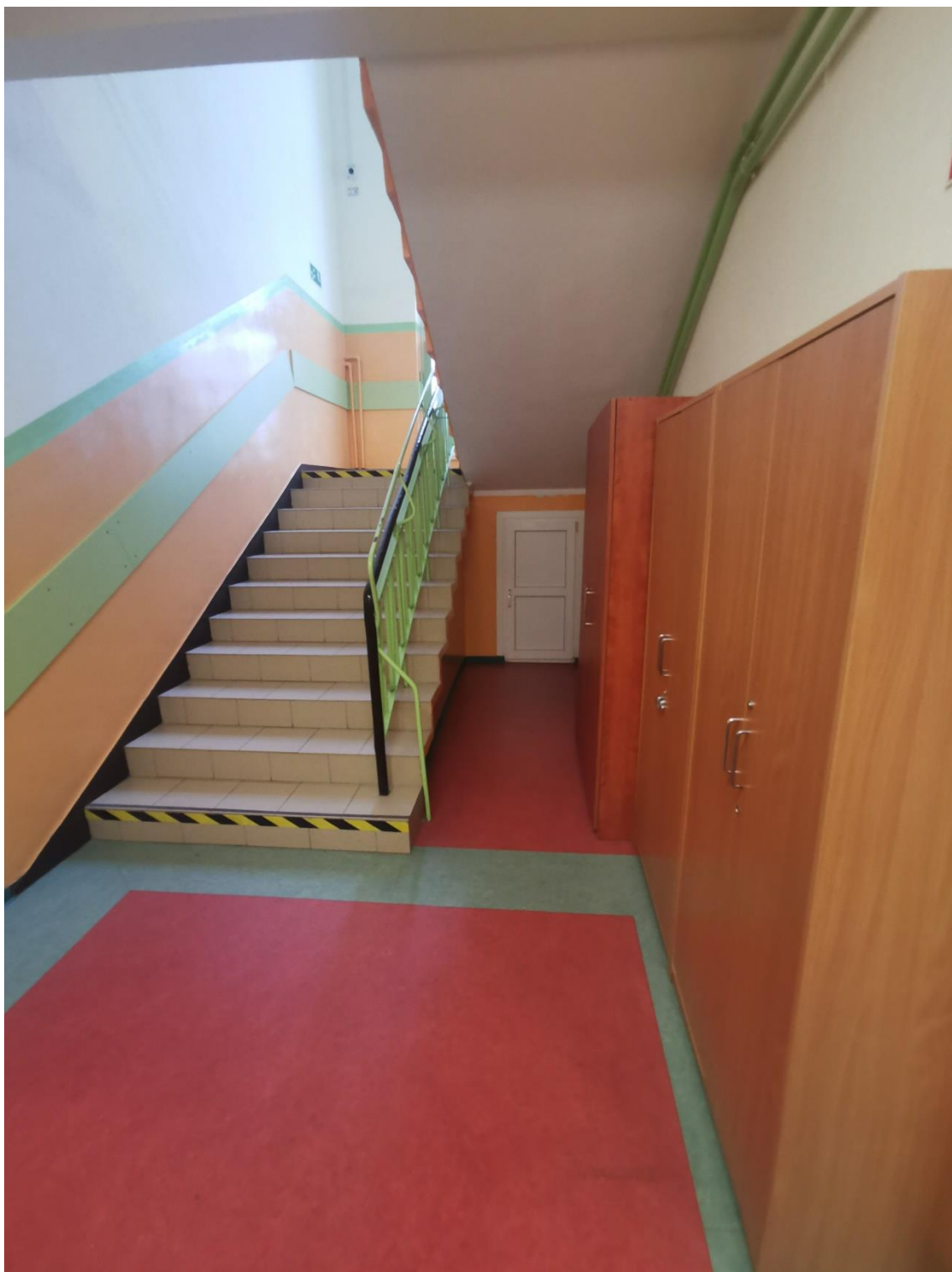
Zdjęcie 8. Miejsce lokalizacji projektowanego układu pompowego dla segmentu B wraz z widocznym istniejącym doprowadzeniem przewodów z pomieszczenia pomocniczego