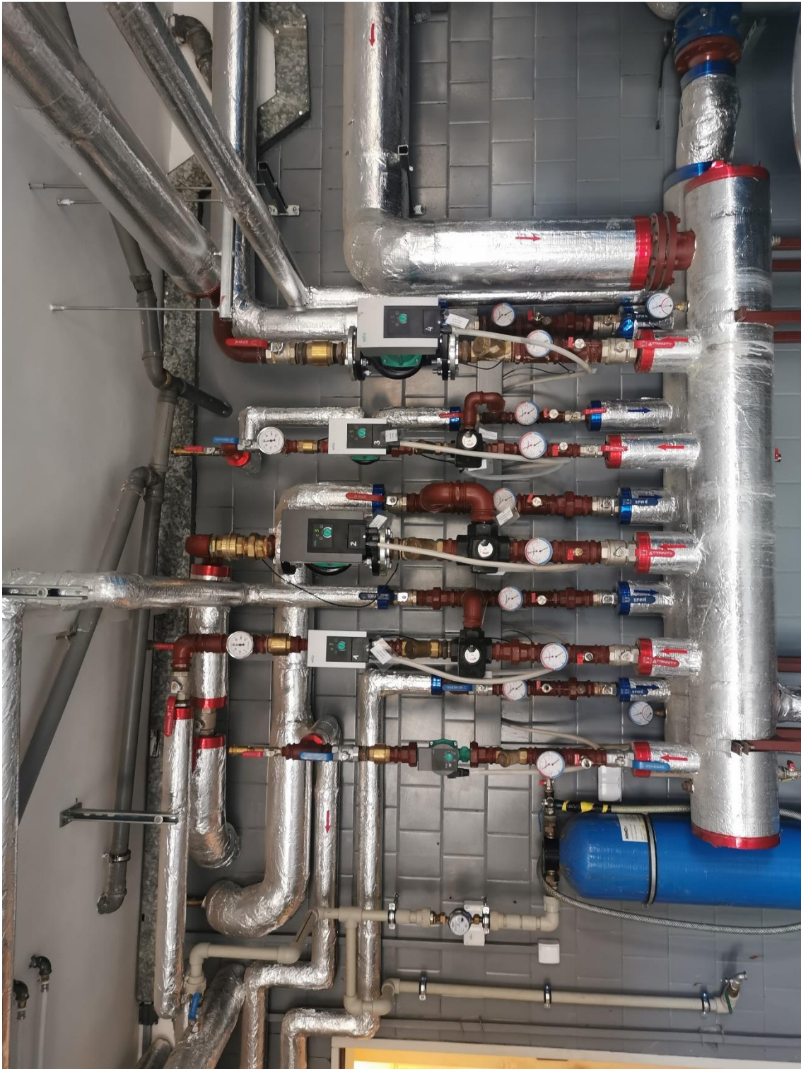
Zdjęcie 3. Widok na istniejący rozdzielacz obiegów grzewczych