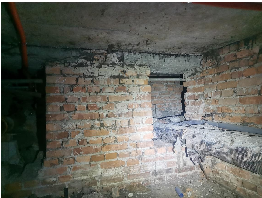
Zdjęcie 6. Istniejący kanał instalacyjny