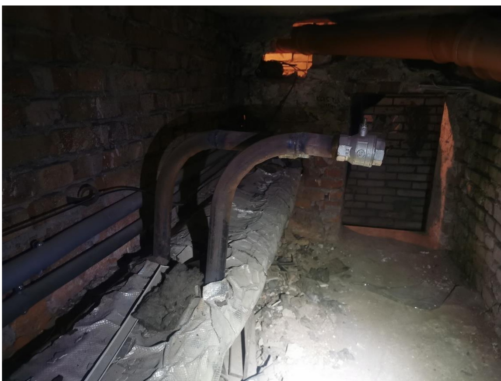
Zdjęcie 7. Widok wejścia do kanału instalacyjnego od środka.