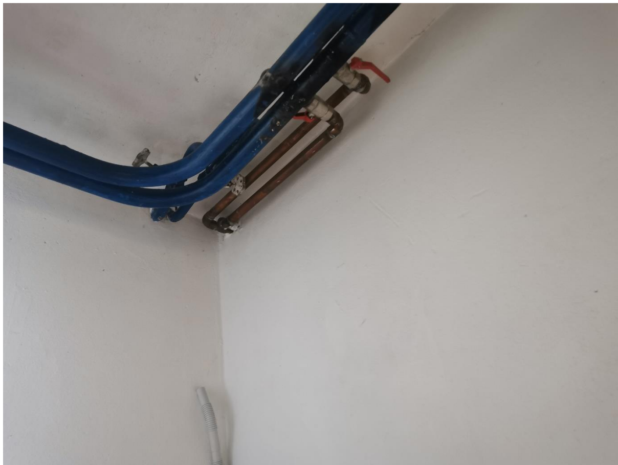
Zdjęcie 10. Miejsce połączenia z istniejącą instalacją w pomieszczeniu magazynowym

W segmencie E do projektowanej instalacji w pomieszczeniu magazynowym E-1.13 należy przełączyć istniejącą instalację centralnego ogrzewania, wykonaną z rur miedzianych, wprowadzoną do budynku sąsiedniego w którym aktualnie znajduje się biblioteka. Z uwagi na zabudowę tej części instalacji nie ma możliwości zdiagnozowania jej rzeczywistego przebiegu i obszaru budynku który obsługuje. Widok tej części instalacji przedstawiono na zdjęciu poniżej.