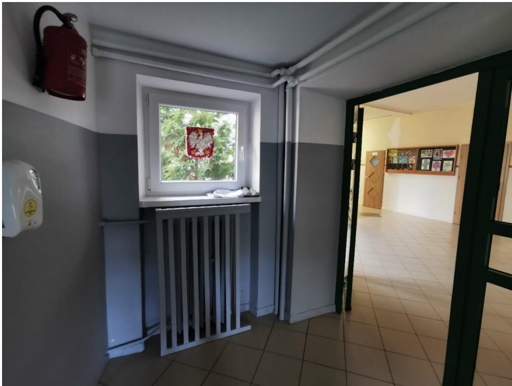
Zdjęcie 9. Miejsce lokalizacji projektowanego układu pompowego dla segmentu D