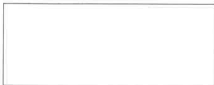
Pieczęć firmowa Wykonawcy