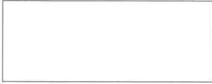
Pieczęć firmowa Wykonawcy