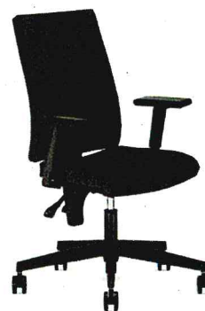
Rysunek nr 2