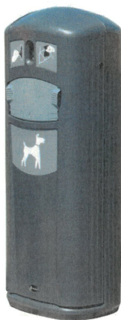
c) kosz na psie odchody z dystrybutorem woreczków