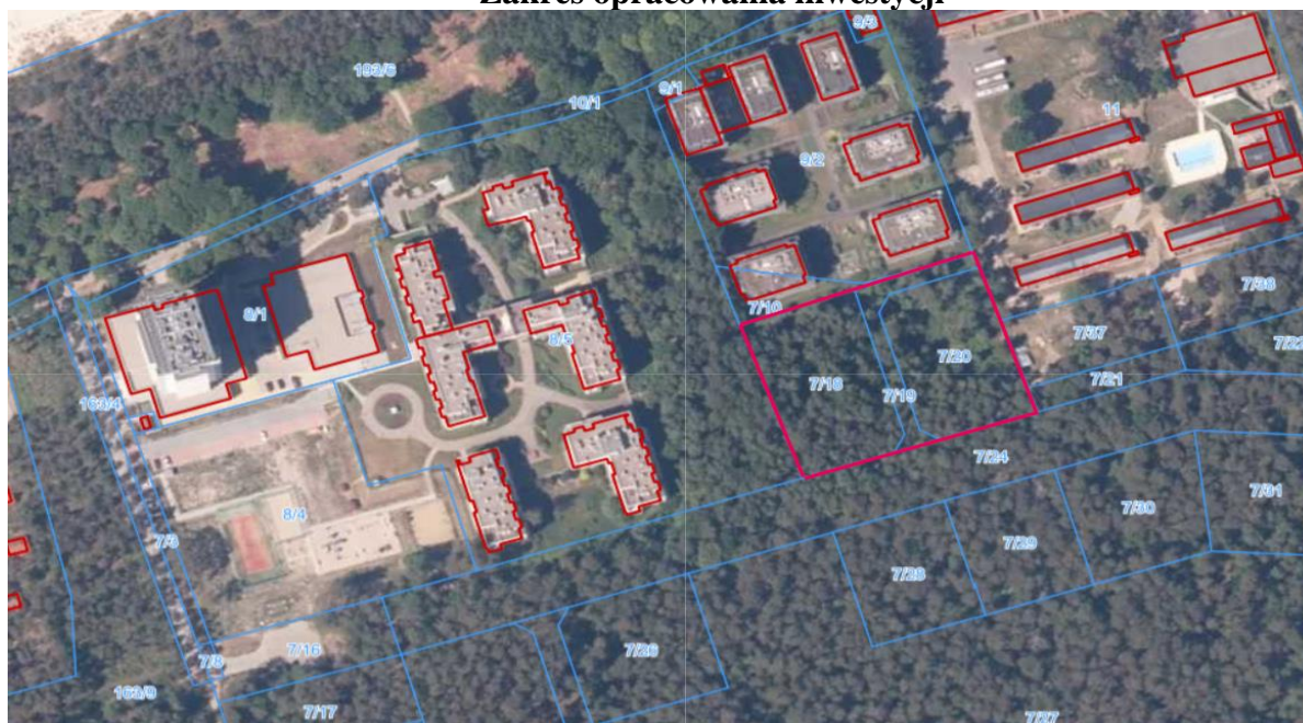
Fragment miejscowego planu zagospodarowania przestrzennego