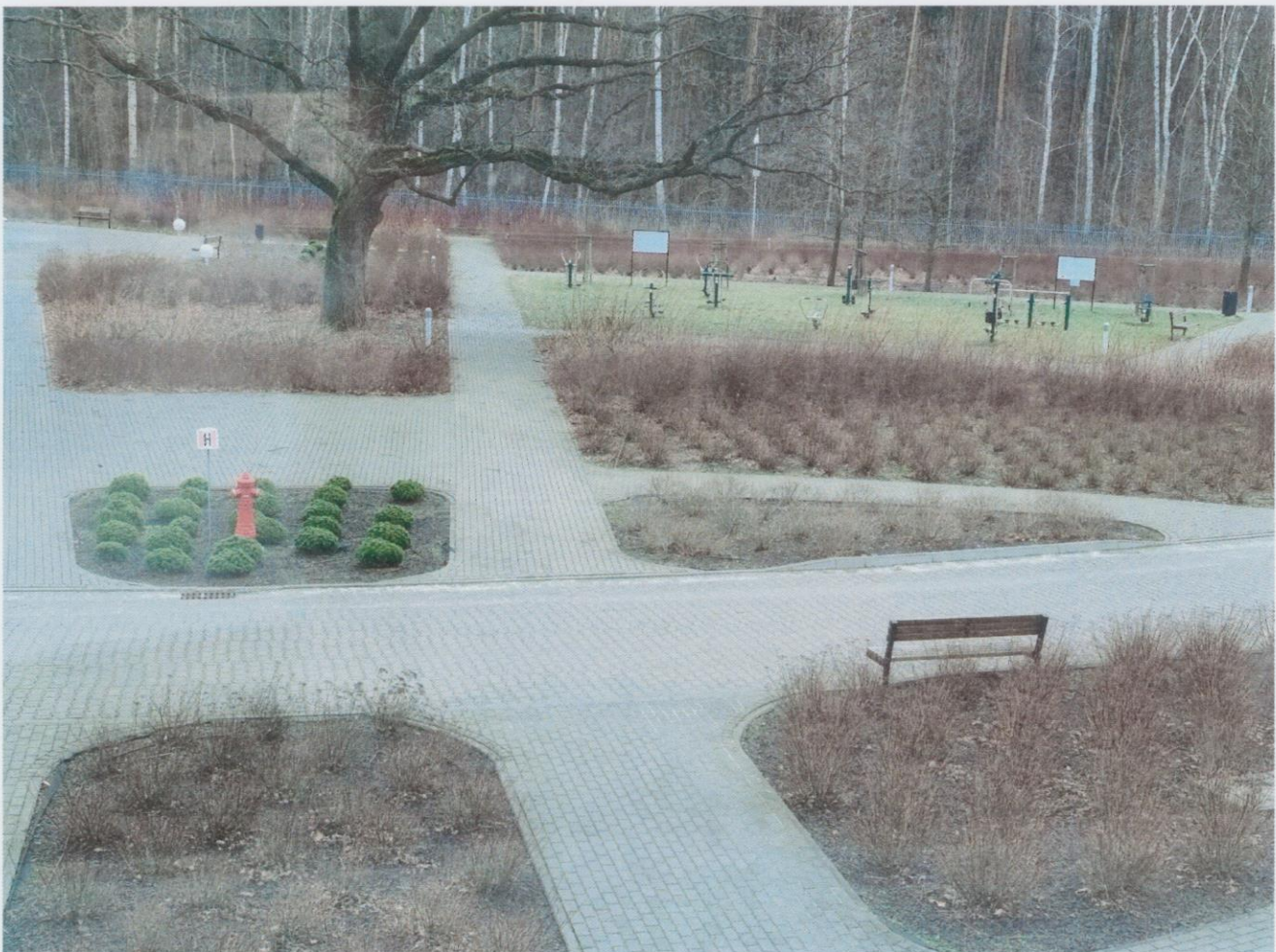
Zdjęcia poglądowe ogrodu