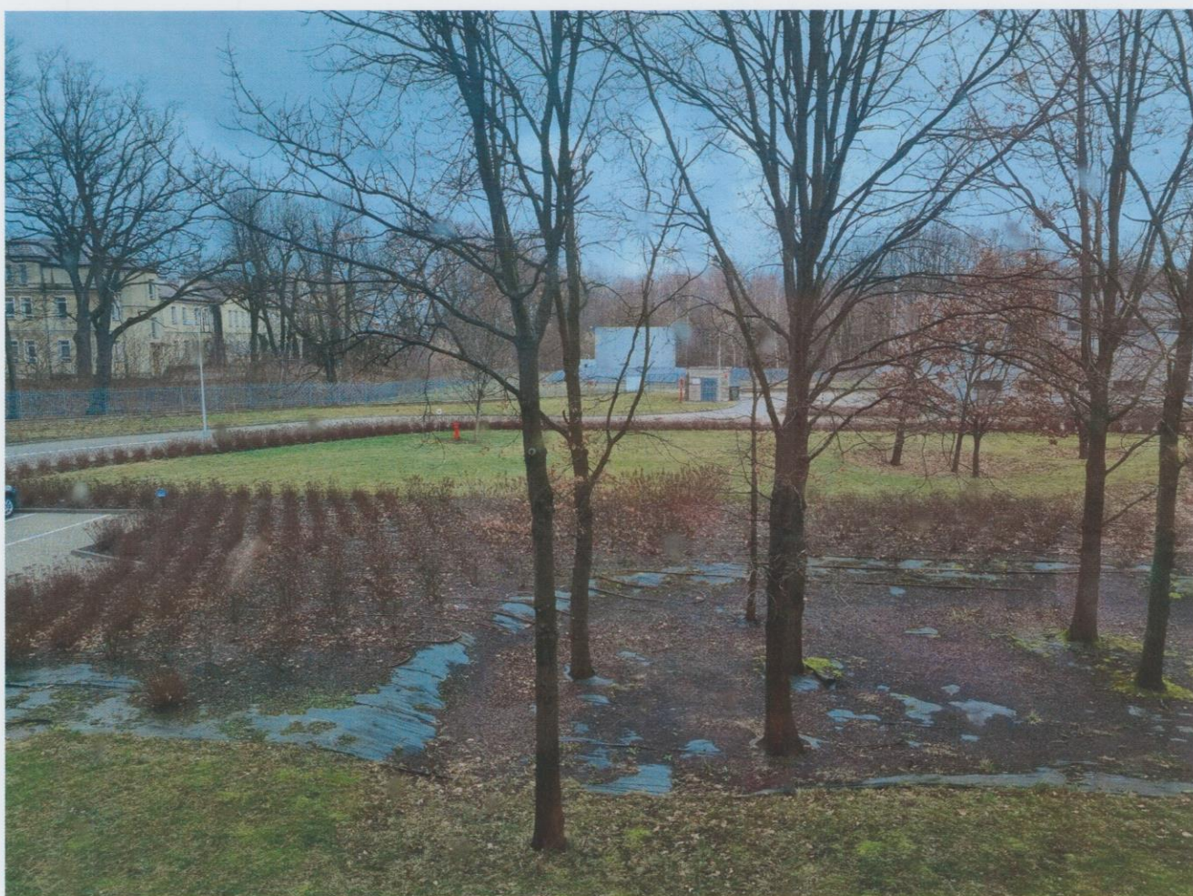
Zdjęcia poglądowe ogrodu