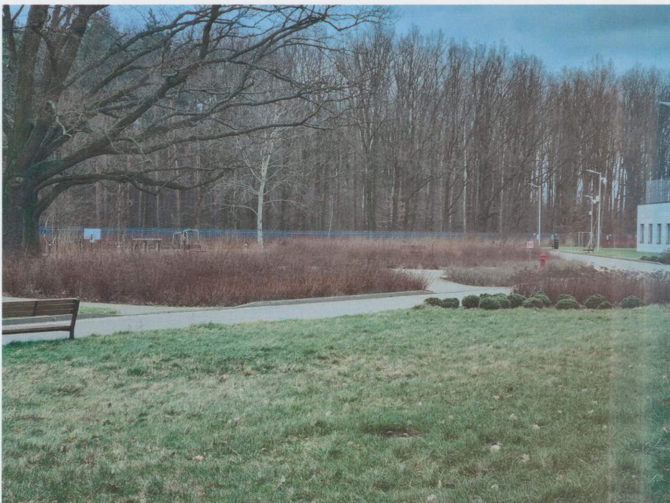
Zdjęcia poglądowe ogrodu