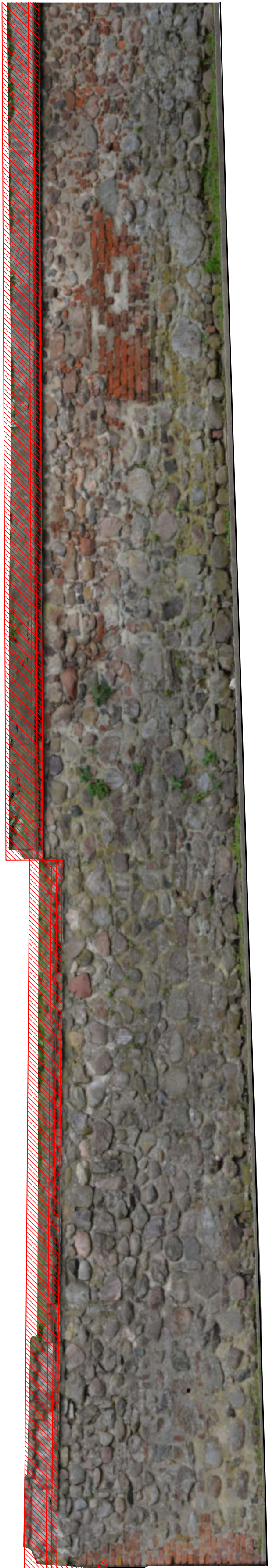
Odcinek C elewacja wewnętrzna, cz. wschodnia, skala 1:50