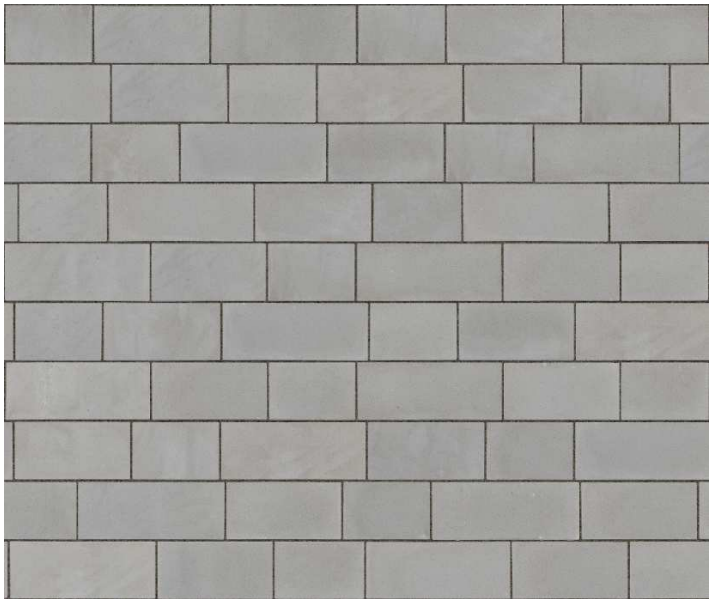
KOSTKA BETONOWA ZDJĘCIE POGLĄDOWE