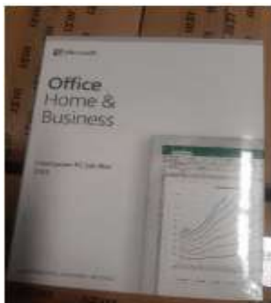
Rys. 3 Przykładowe zdjęcie pudełka dla produktu Microsoft Home&Business

Jesteśmy przekonani, że dzięki takiemu zapisowi do wzoru umowy Zamawiający otrzyma od potencjalnego Wykonawcy w pełni oryginalne oprogramowanie zgodne z warunkami licencjonowania producenta oprogramowania. W przeciwnym razie Zamawiający - jako odbiorca końcowy, ponoszący odpowiedzialność za oprogramowanie które zakupił – narazi się na konsekwencje finansowe i prawne, związane z użytkowaniem nielegalnego lub zabronionego, używanego wcześniej oprogramowania.