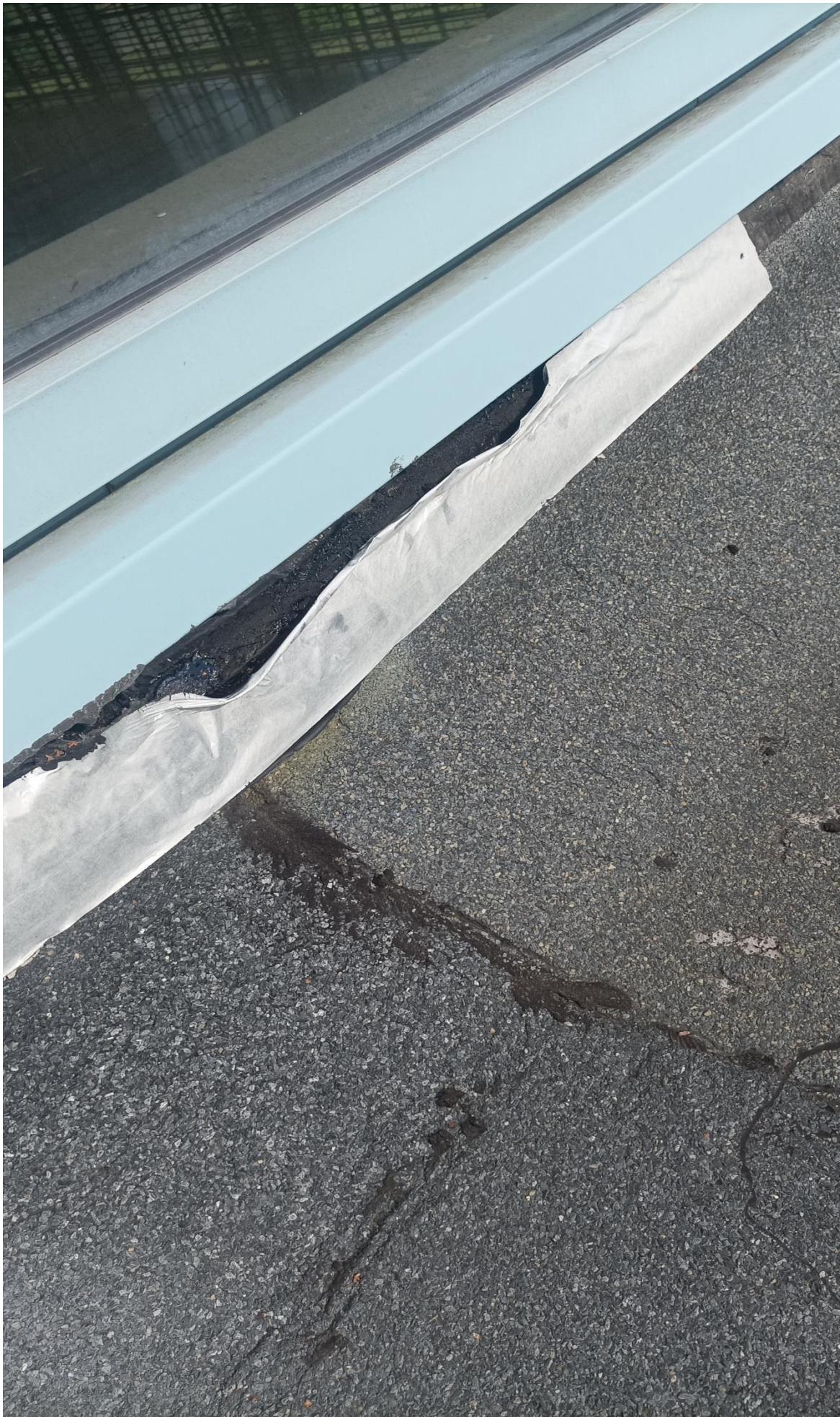
Sporządził: mgr inż. Robert Strzelecki ( Główny Specjalista ds. Technicznych)