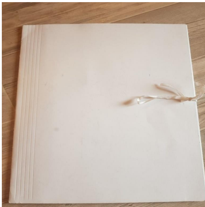
Rys. 1. Zdjęcie przedstawia teczkę wiązaną bezkwasową do archiwizacji dokumentów bez nadruku (strona zewnętrzna)

załącznik nr 3 postępowania numer: KA-DZP.362.2.28.2021