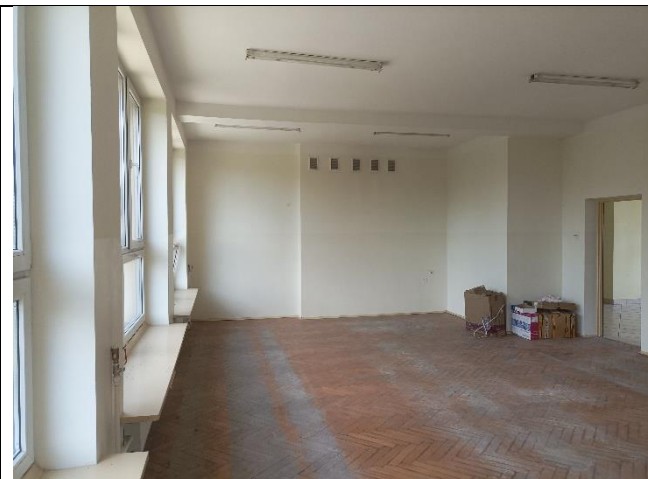
Pom. 1.14 sala