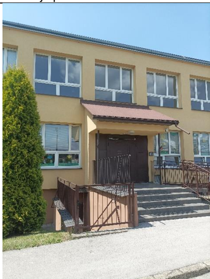
Elewacja północno - wschodnia