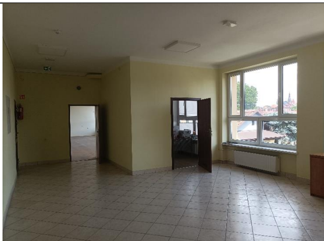
Pom. 1.7 komunikacja