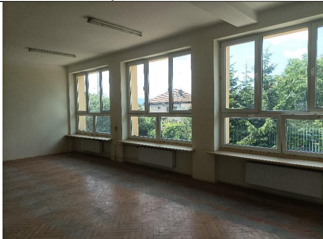
Pom. 1.14 sala