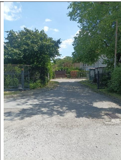
Wyjazd do ul. Podhalańskiej