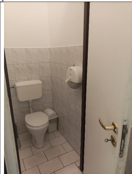
Pom. 1.6 łazienka