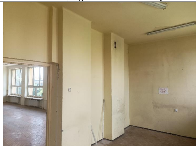
Pom. 1.11 magazyn