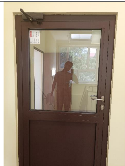
Pom. 1.13 klatka schodowa