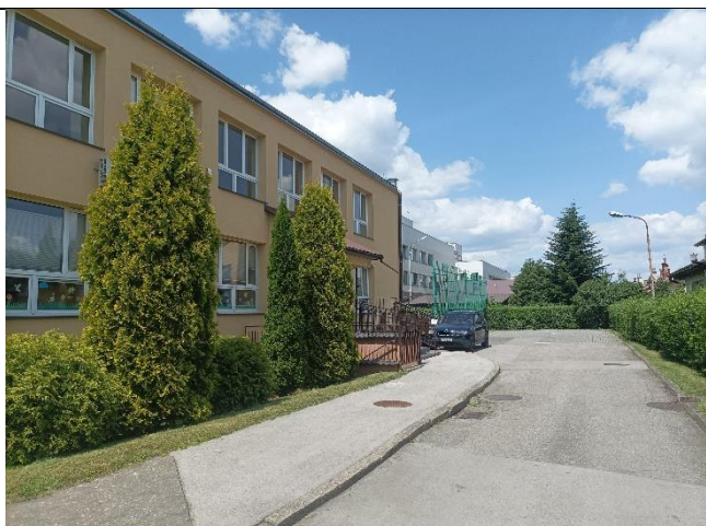
Elewacja północno - wschodnia