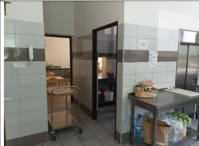
Pom. 0.9 przygotowalnia