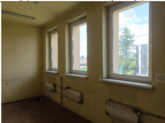
Pom. 1.11 magazyn