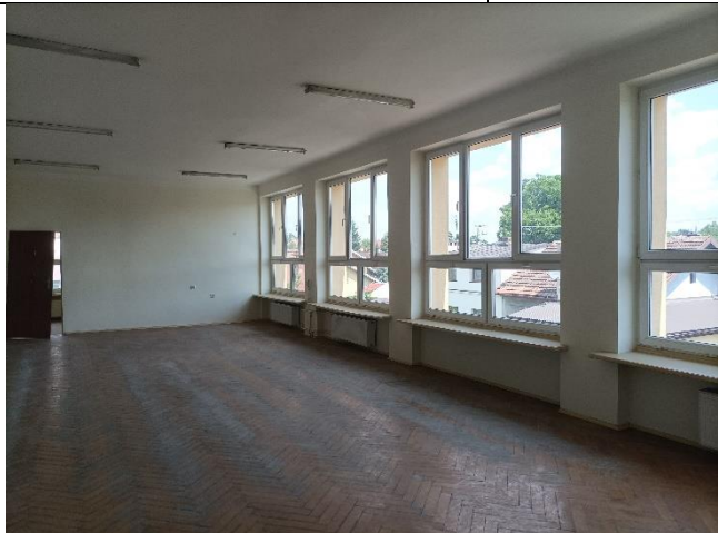
Pom. 1.12 sala