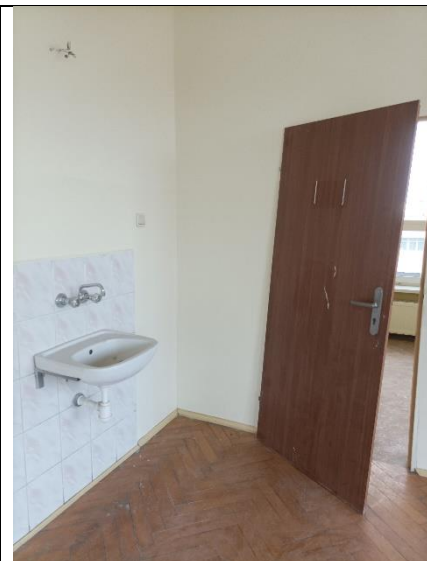
Pom. 1.9 sala