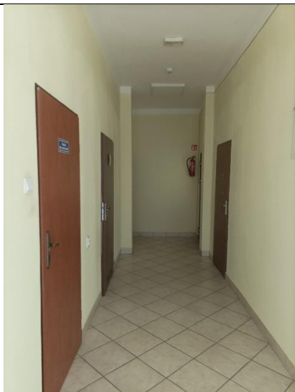
Pom. 1.7 komunikacja