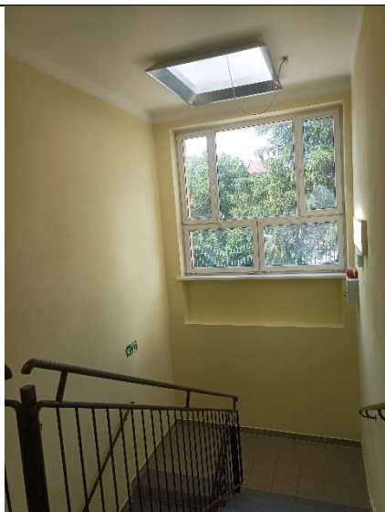
1.13 klatka schodowa