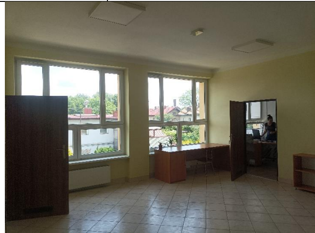
Pom. 1.7 komunikacja