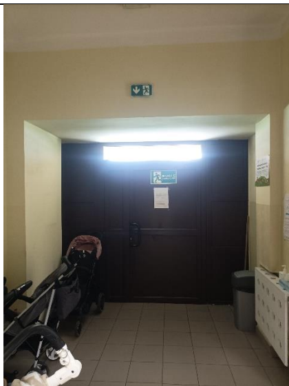
Pom. 0.1 wiatrołap