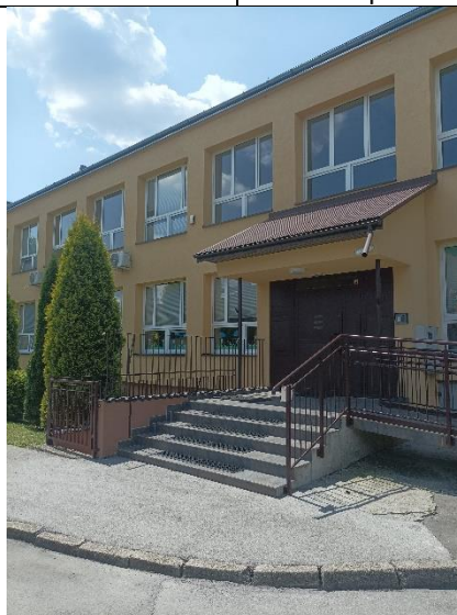
Elewacja północno - wschodnia