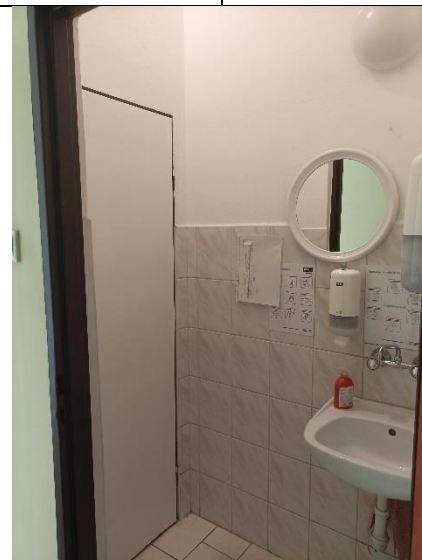
Pom. 1.6 łazienka