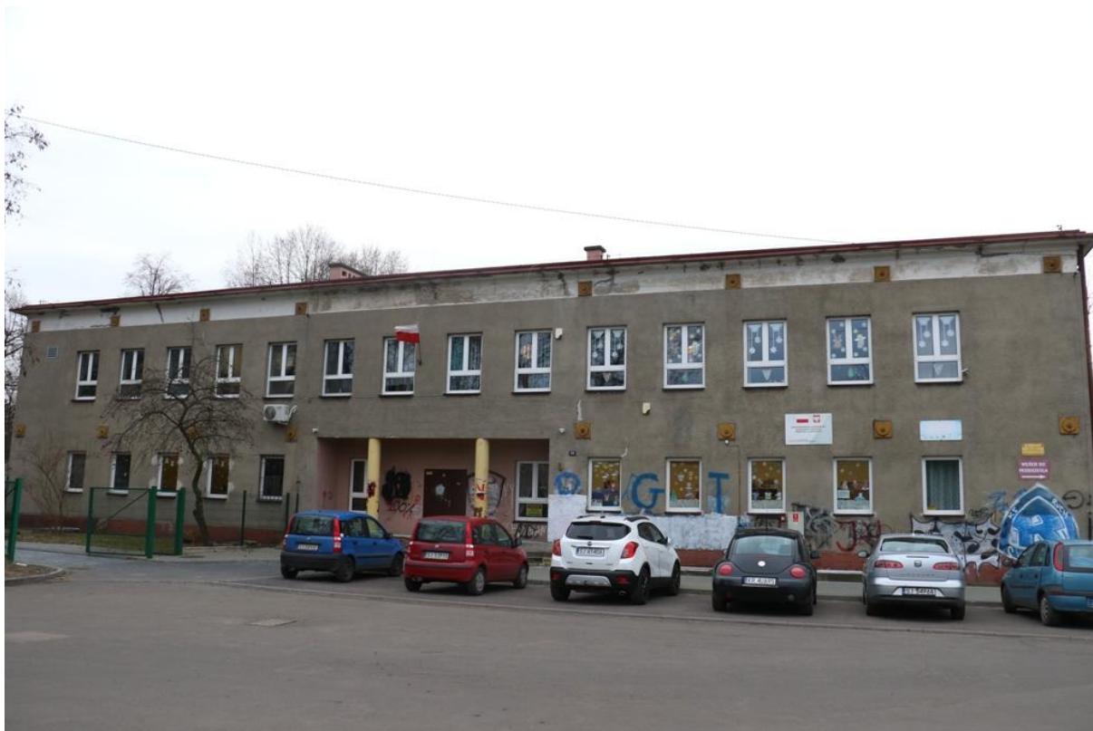
Fot. 2. Azot 16, Jaworzno - ściana północna