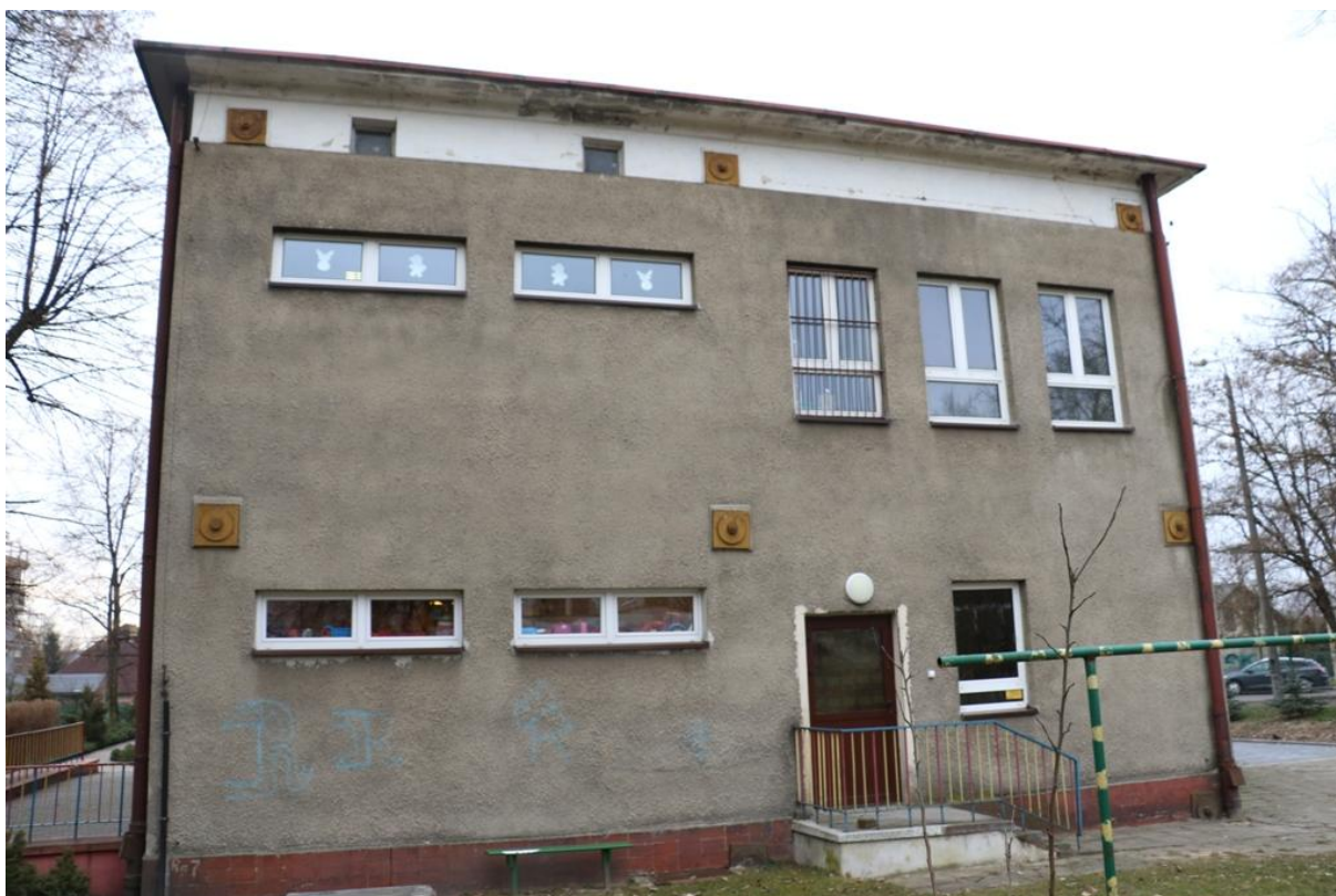
Fot. 3. Azot 16, Jaworzno - ściana wschodnia