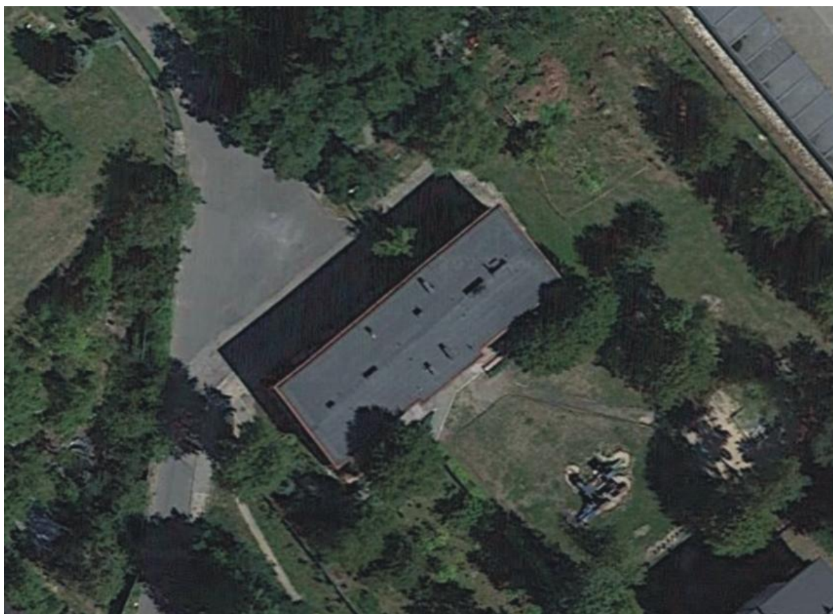
Fot. 1. Budynek przy ulicy Azot 16 w Jaworznie

Inwentaryzowany obiekt to dwukondygnacyjny budynek przedszkolny. Brak drożnych otworów wentylacyjnych stropodachu.