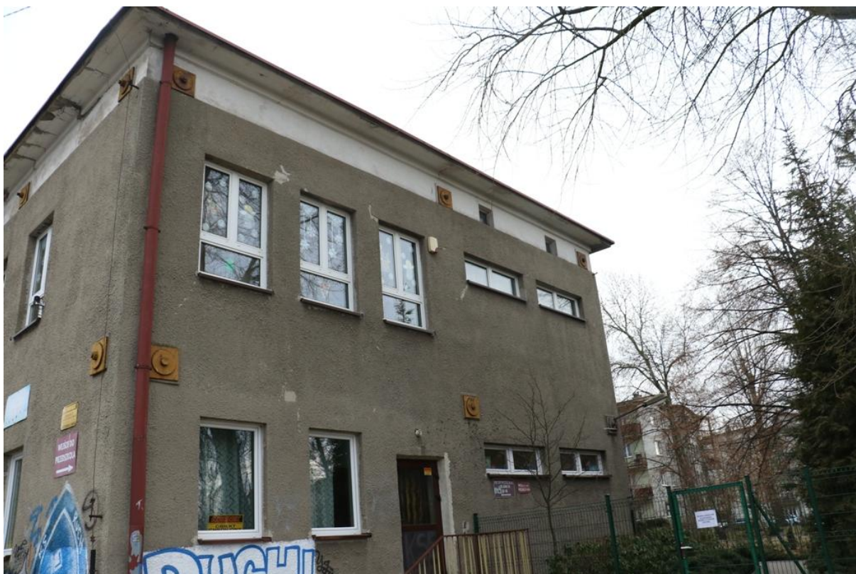
Fot. 5. Azot 16, Jaworzno - ściana zachodnia