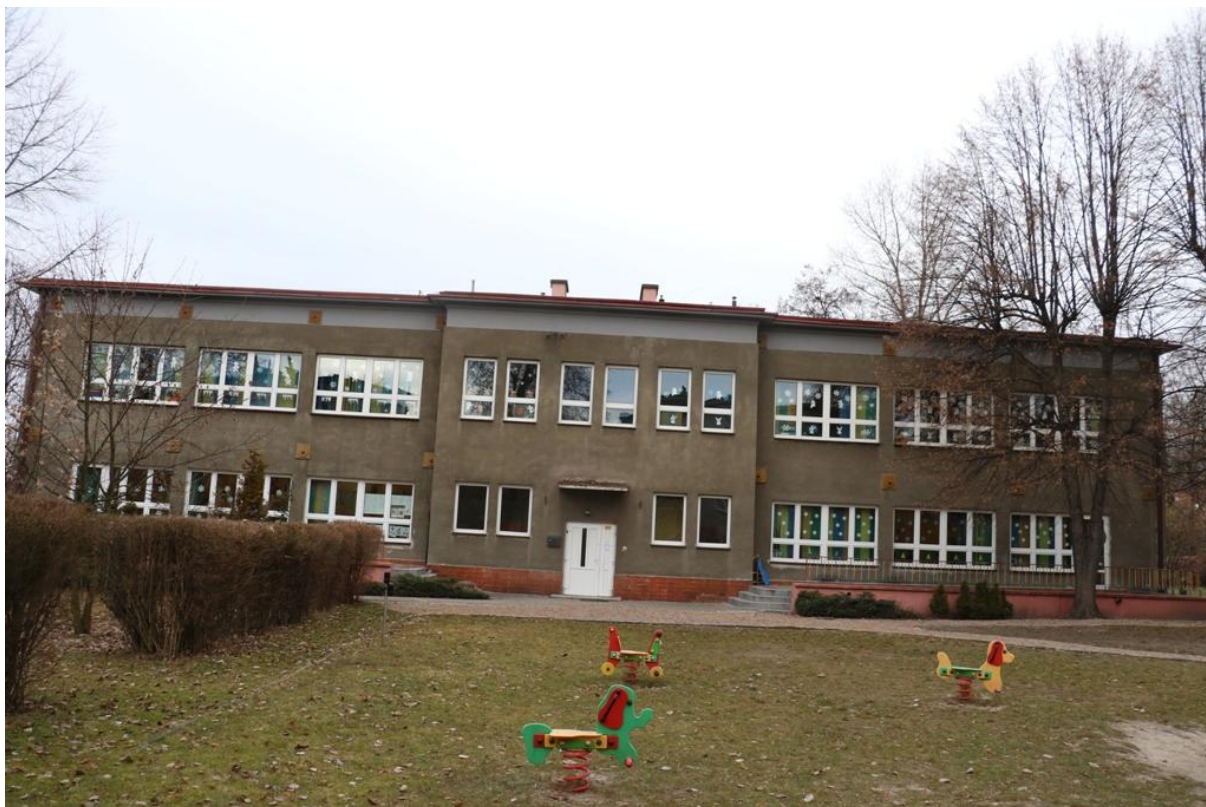
Fot. 4. Azot 16, Jaworzno - ściana południowa