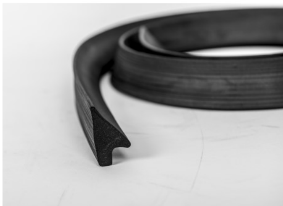
Fot. 5. Przykład uszczelki „klinowej”