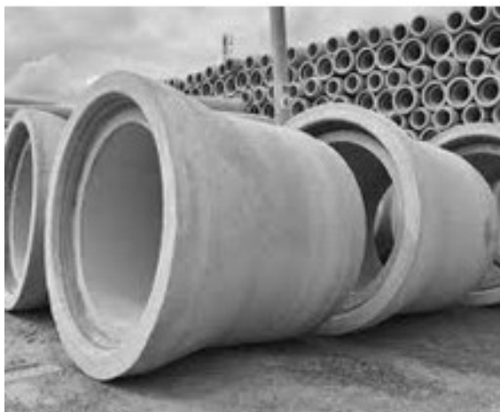
Fot. 4. Przykład prefabrykatu rurowego z kielichem ukształtowanym w formie zamka