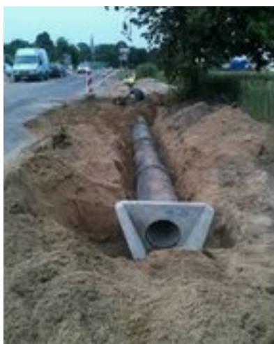
Fot. 7. Przepust z zamontowanym elementem wylotu