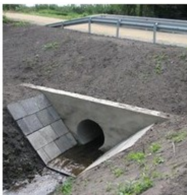
Fot. 8. Przykłady umocnienia skarp i dna rowu w sąsiedztwie wylotu przepustu