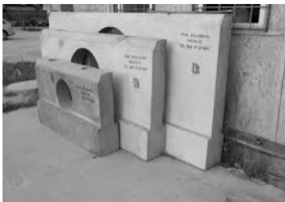
Fot. 1. Przykład prefabrykowanej ścianki czołowej przepustu