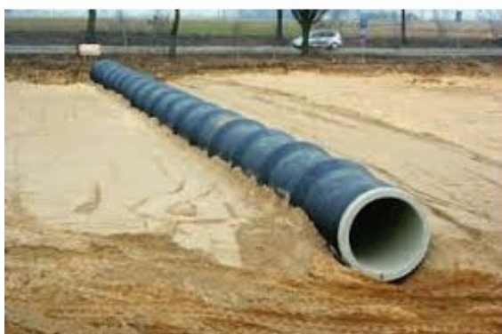
Fot. 6. Zmontowana część przelotowa przepustu