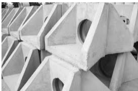
Fot. 2. Przykład prefabrykowanej ścianki wlotu przepustu ze skrzydłami