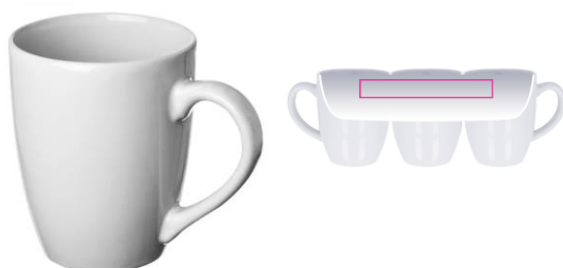
4. INSIDE TC