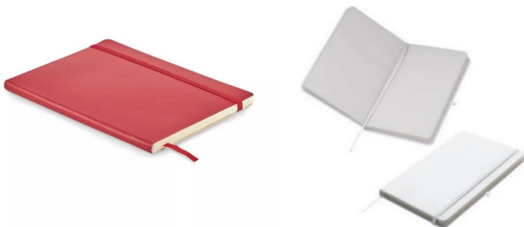
Obraz 1 Przykładowy notatnik