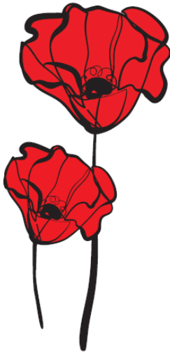
Obraz 12 Znak maków

Dostawa wraz z wniesieniem do pomieszczenia wskazanego przez Zamawiającego w Urzędzie Marszałkowskim Województwa Mazowieckiego w Warszawie - Departament Organizacji, I piętro (jest winda), ul. Jagiellońska 26 (wejście B), Warszawa