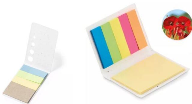
Obraz 5 Przykładowe notatniki