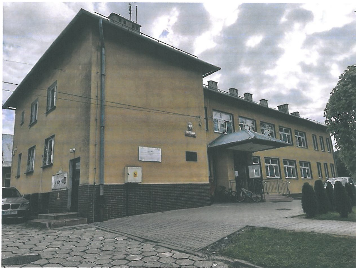
Rys.3. Elewacja zachodnia budynku .