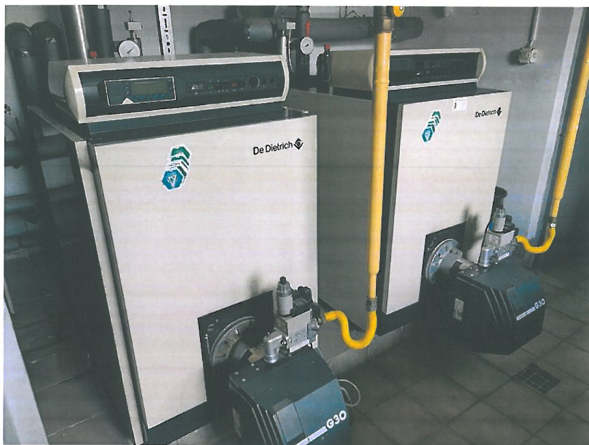
Rys.19. Dwa kotły gazowe.