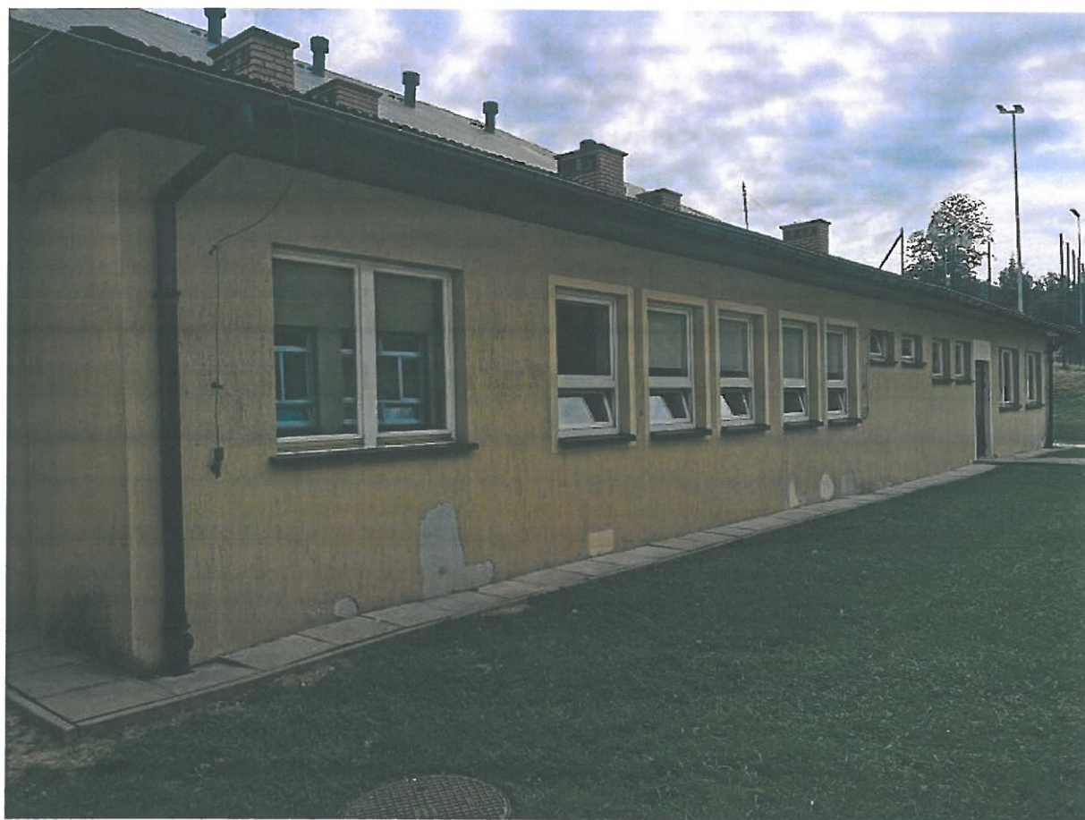
Rys.7. Elewacja zachodnia budynku.