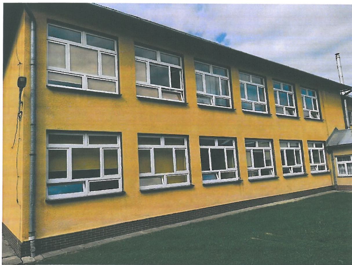
Rys.6. Elewacja zachodnia budynku.