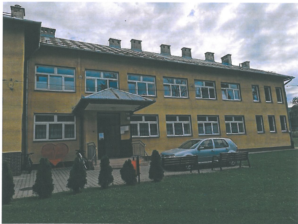
Rys.4. Elewacja zachodnia budynku.