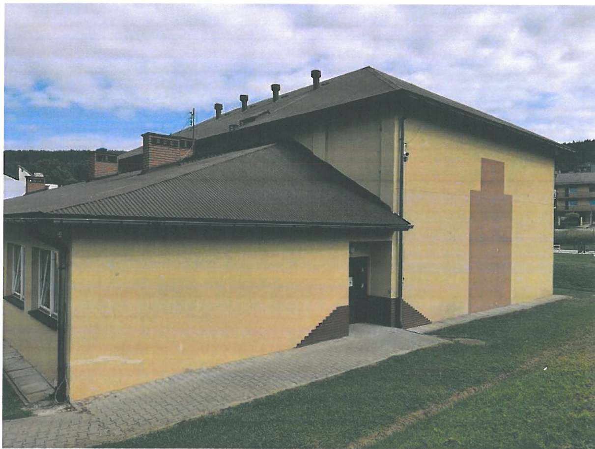
Rys. 8. Elewacja południowa budynku.