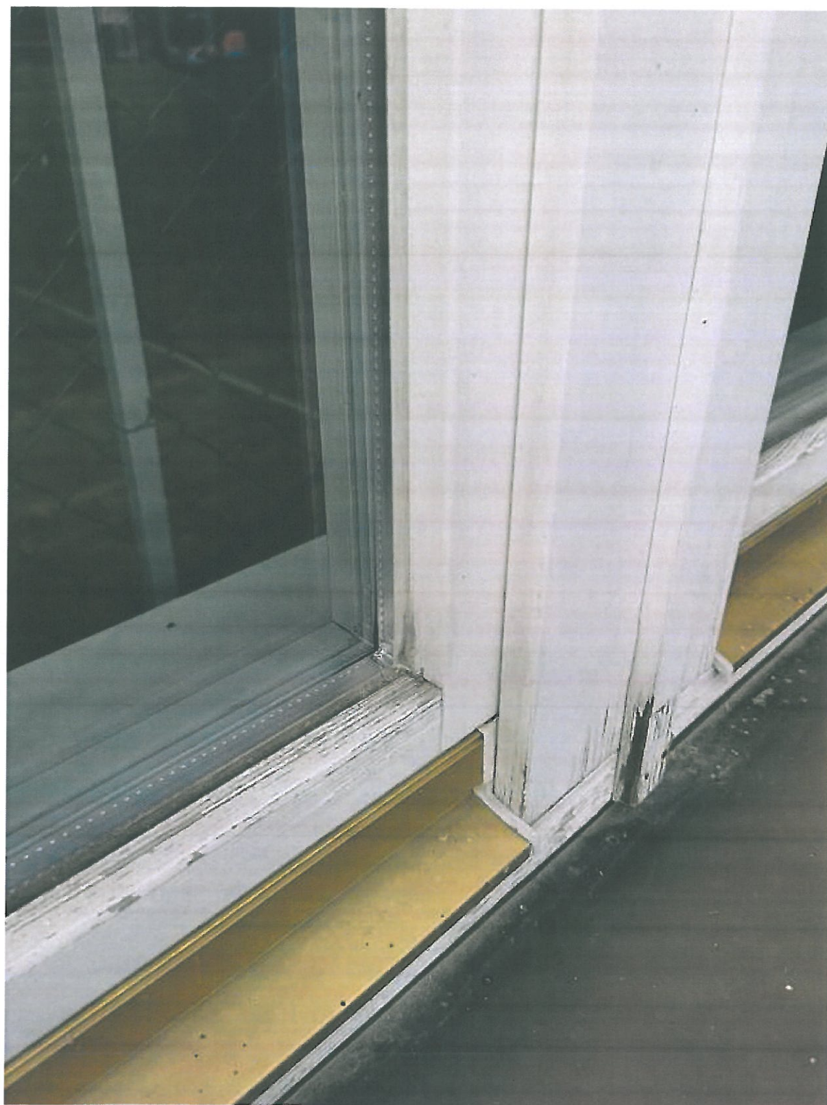
Rys.16. Stolarka okienna drewniana przeznaczona do wymiany.