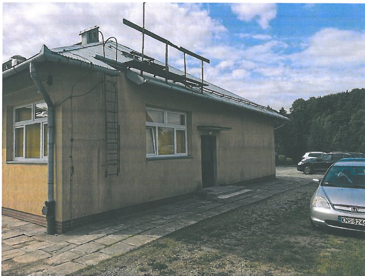
Rys. 12. Elewacja północna budynku.