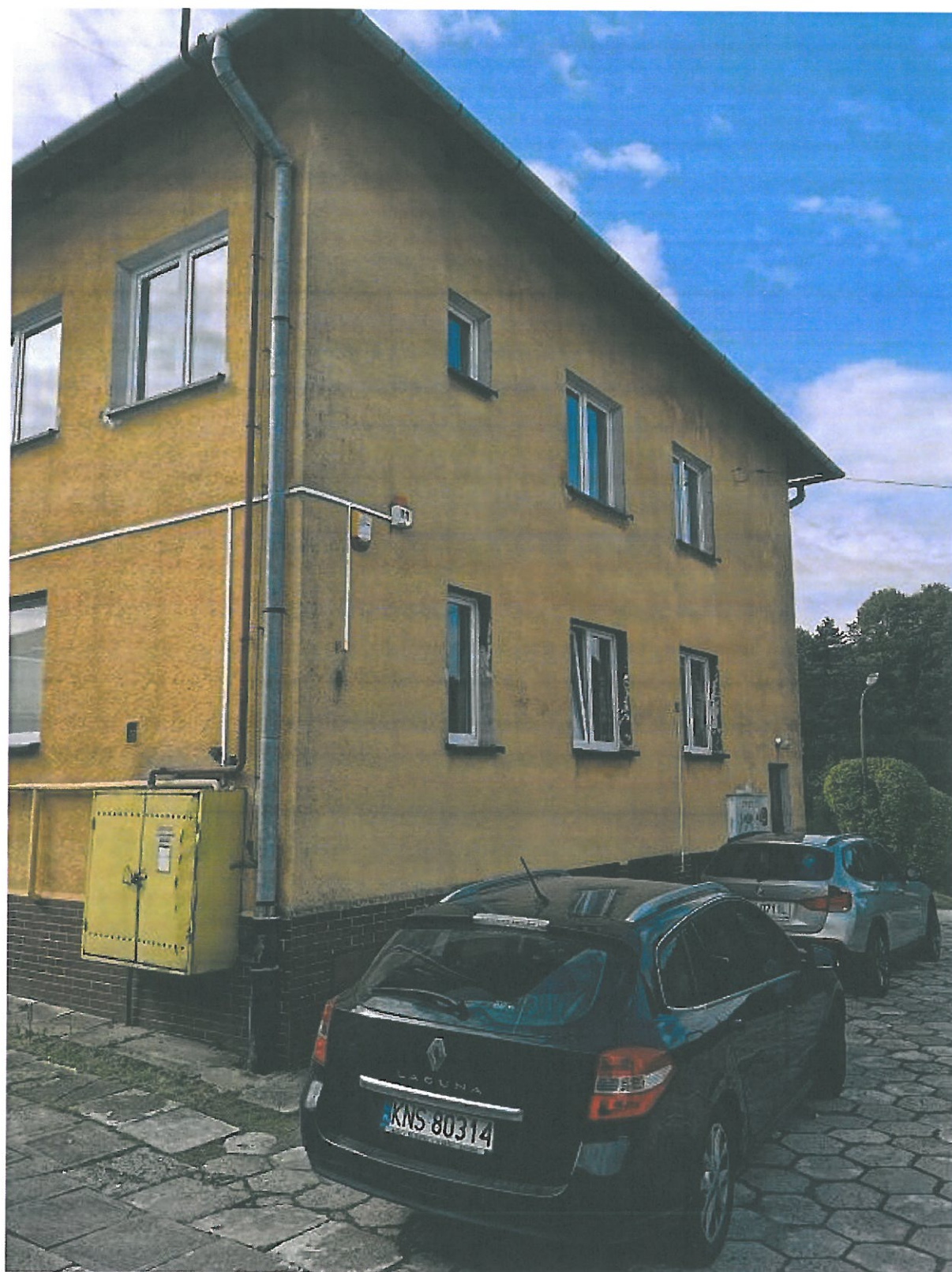
Rys.14. Stolarstwo zewnętrzne drewniane przeznaczone do wymiany na elewacji zachodniej.