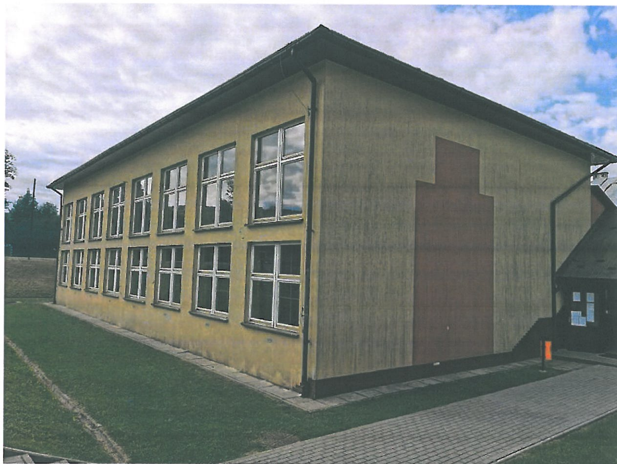
Rys. 11. Elewacja północna budynku.