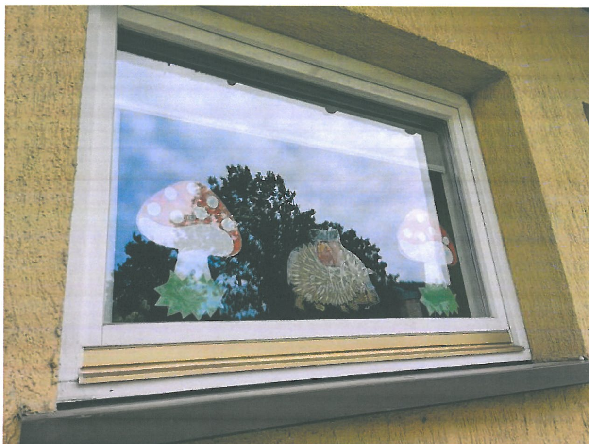
Rys.17. Stólarka okienna drewniana przeznaczona do wymiany.