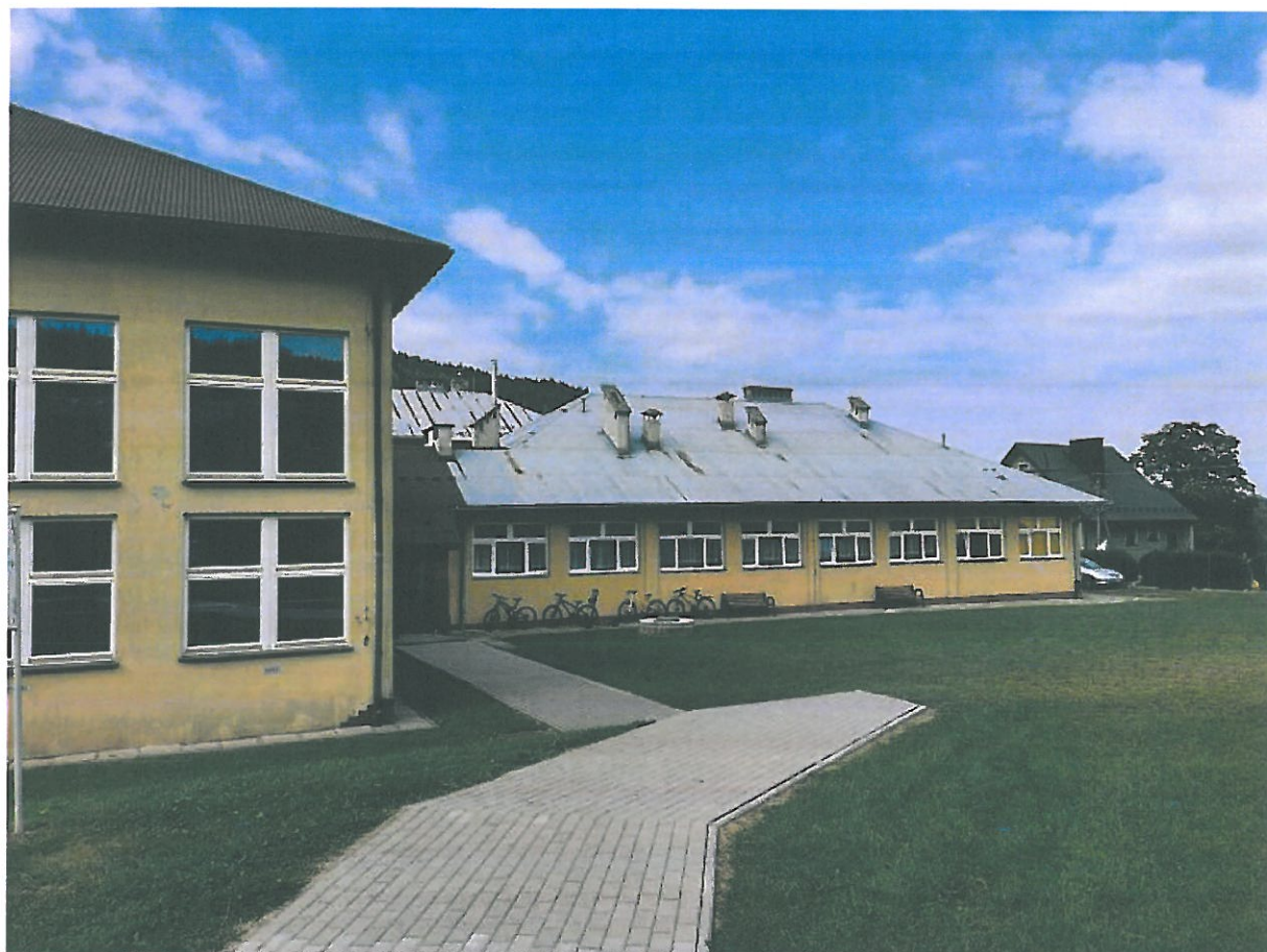
Rys. 10. Elewacja wschodnia budynku.