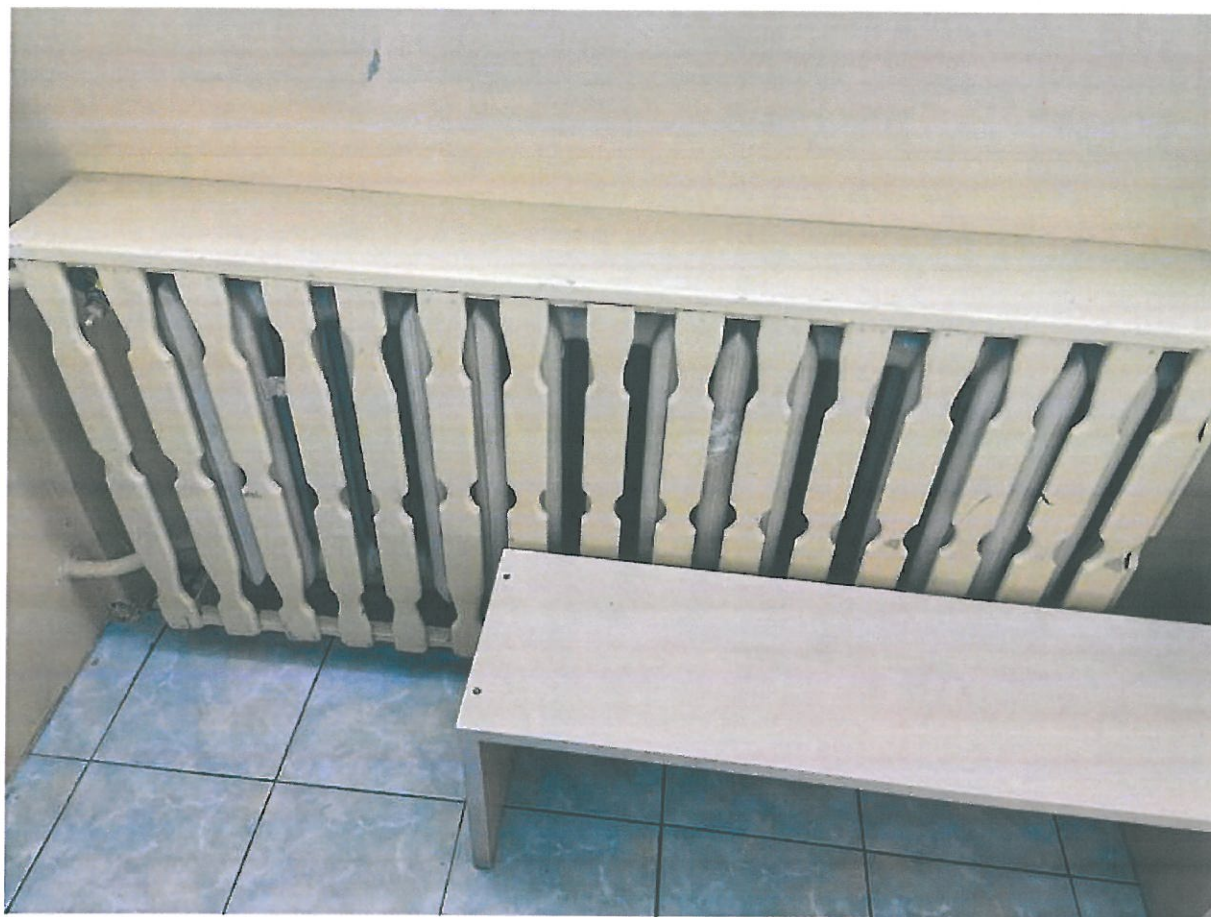
Rys.18. Zabudowany grzejnik żeliwny bez zaworu termostatycznego.