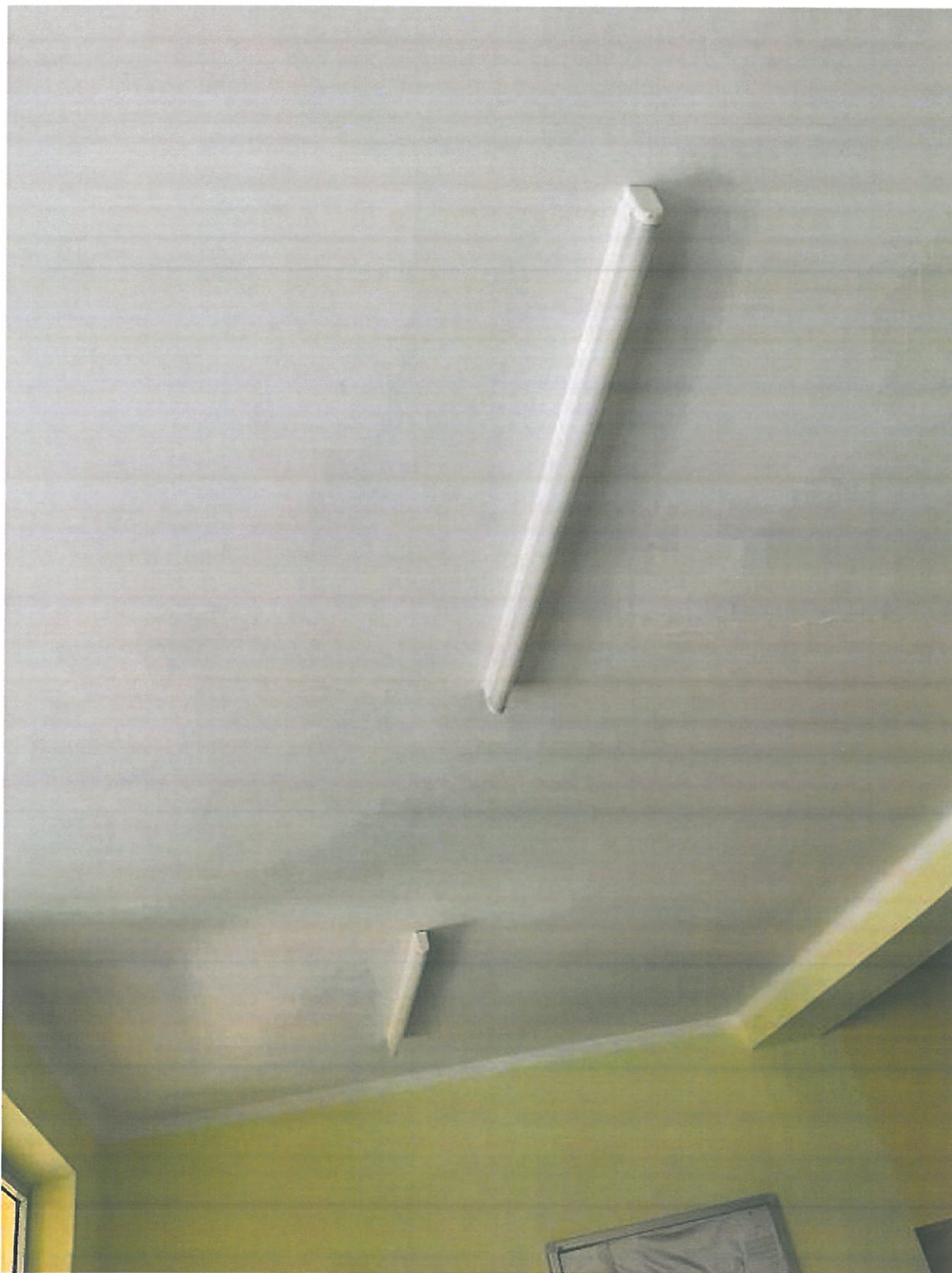
Rys.21. Oprawa świetłówkowa przeznaczona do wymiany.