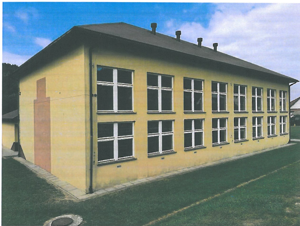
Rys.9. Elewacja wschodnia budynku.