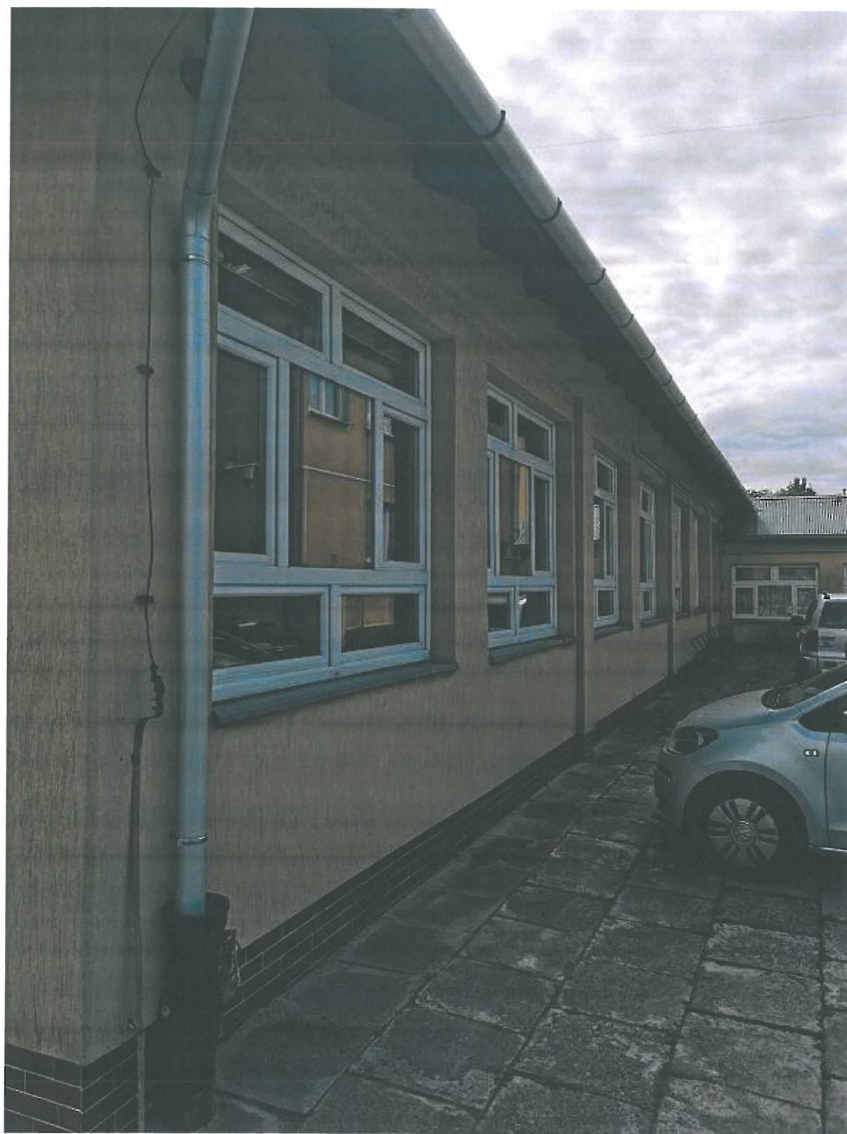
Rys. 13. Elewacja zachodnia budynku.