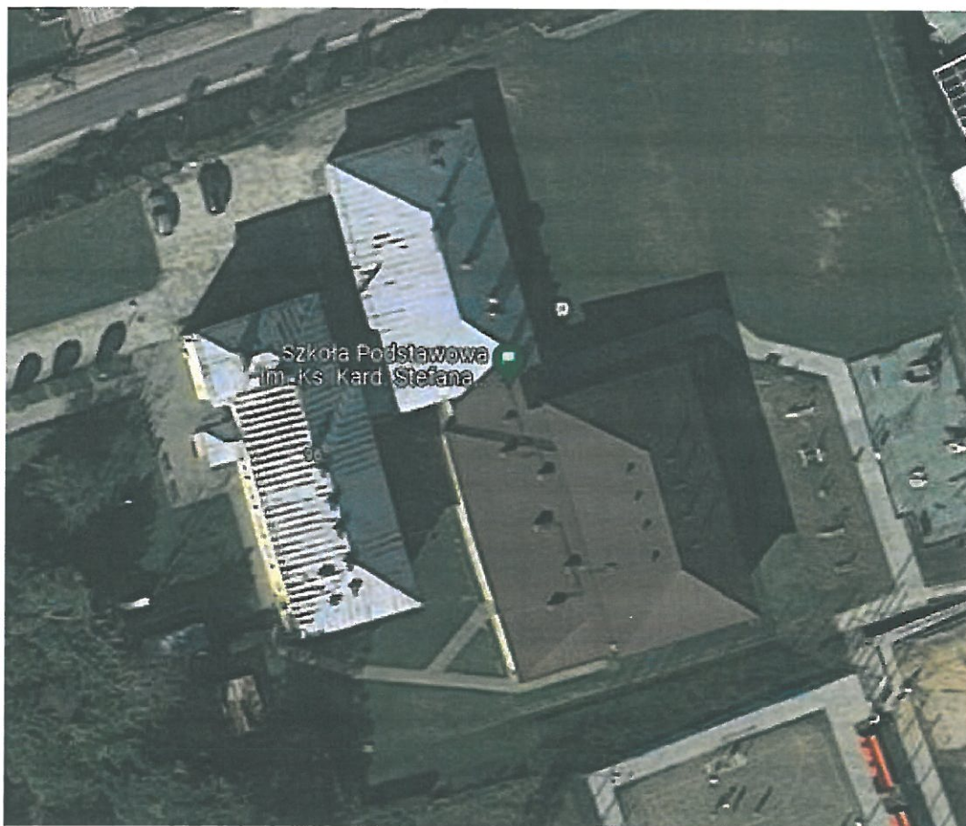
Rys.2. Widok z góry na Szkołę Podstawową w Nowej Wsi.