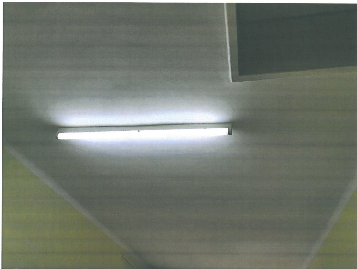
Rys.22. Oprawa świetłówkowa przeznaczona do wymiany.