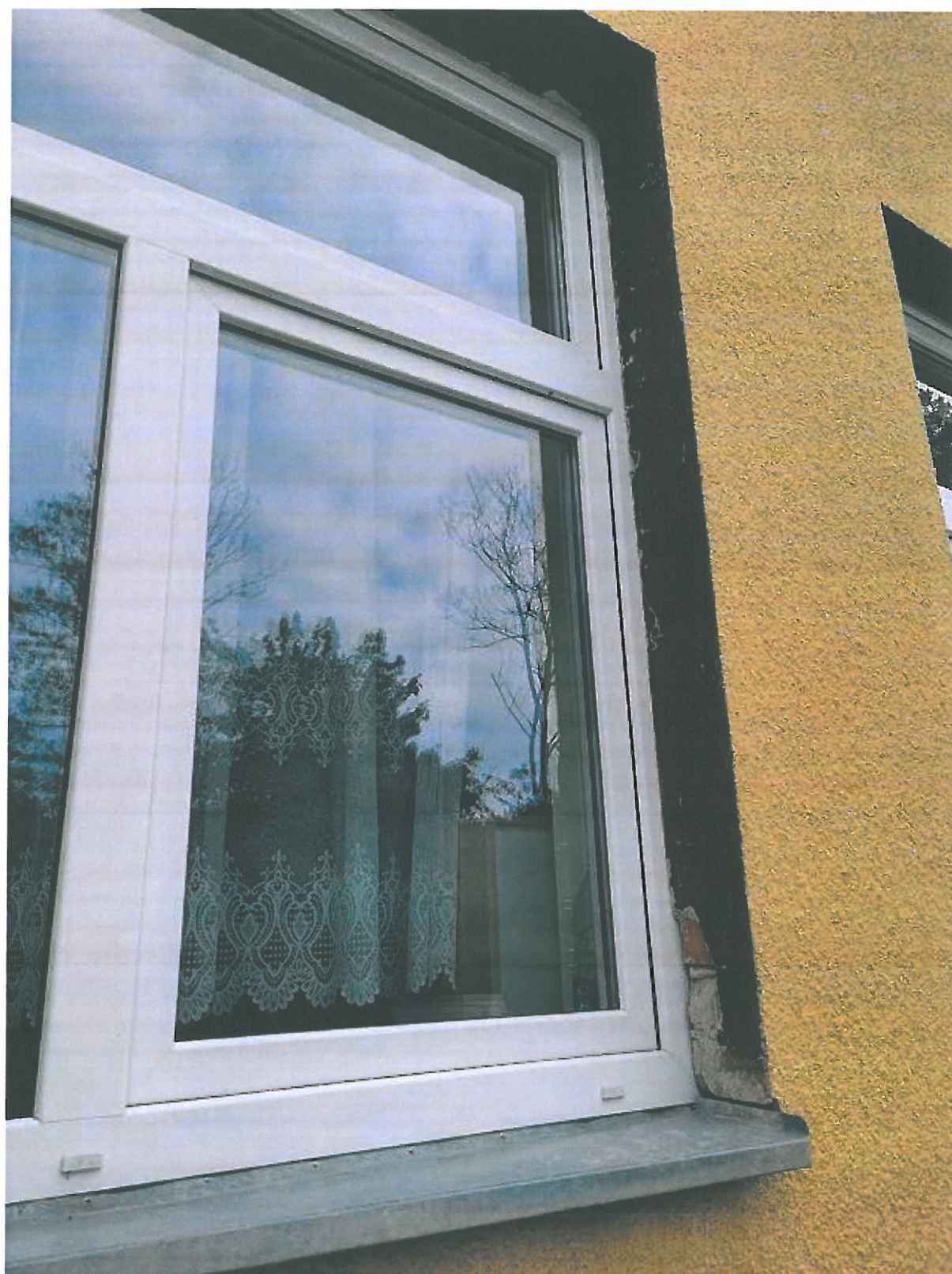
Rys.15. Stalarka okienna z profili PCW przeznaczona do wymiany.