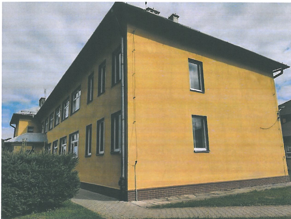
Rys.5. Elewacja południowa budynku.