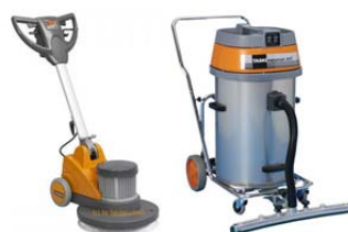
Usuwanie powłok (metoda pośrednia) mechaniczna i chemiczna procedura usuwania starych powłok na posadzkach. Po upływie czasu oczekiwania zanieczyszczony roztwór jest usuwany za pomocą odkurzacza.