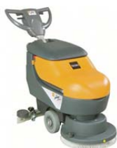
Szorstowanie i osuszanie metoda jednoczesnego szorstowania i usuwania zanieczyszczonego roztworu.