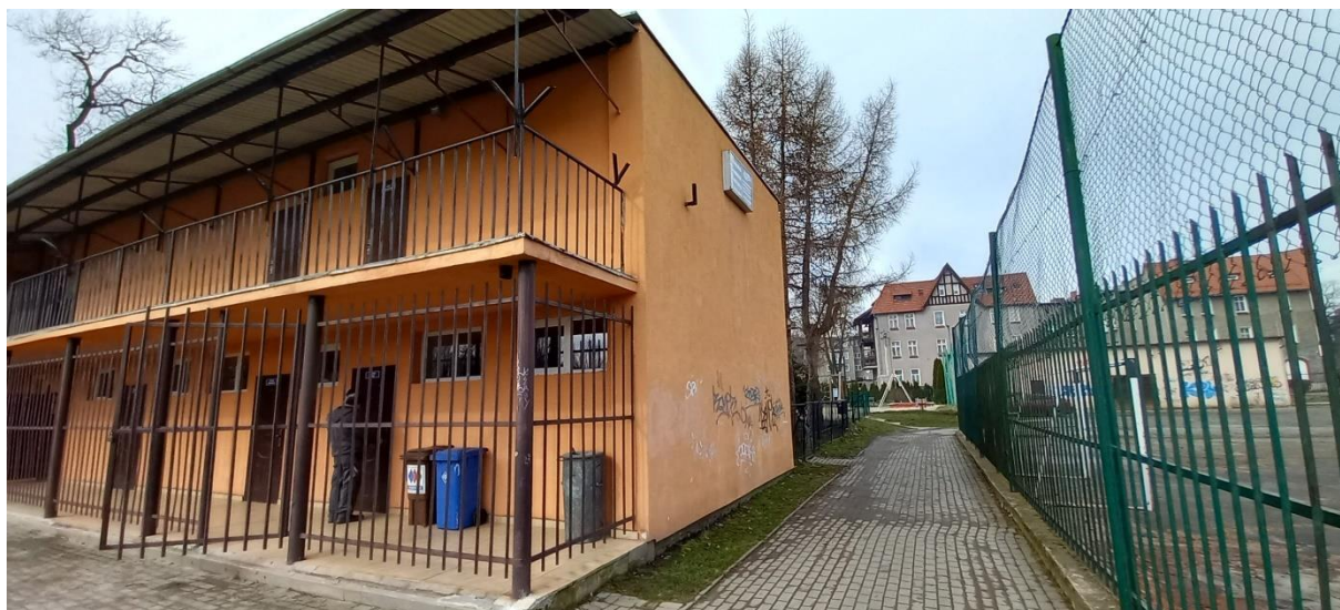
Fot. 7 Ciąg pieszo jezdny, ogrodzenie – stan istniejący.