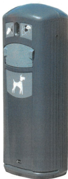
c) kosz na psie odchody z dystrybutorem woreczków