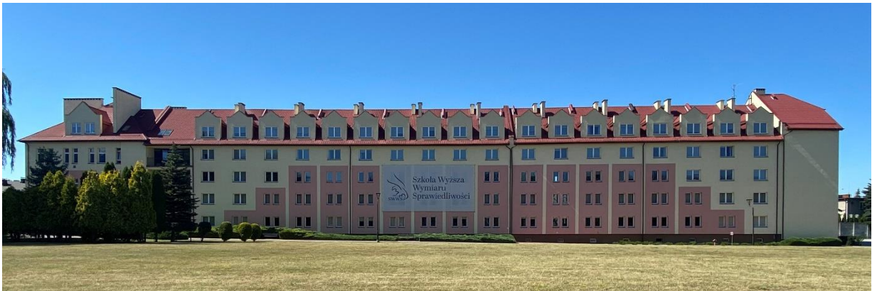
Fotografia 1. Budynek nr 23 (DS-1)