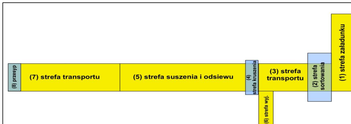
Rysunek 1. Blokowy schemat układu technologicznego linii suszenia szkła.

Dobór maszyn i urządzeń wchodzących w skład linii technologicznej służącej do suszenia i wstępnej segregacji mechanicznej odpadów ze szkła powinien wynikać z projektu technologicznego przedstawionego przez Oferenta. Poniżej, zostały przedstawione parametry wynikające z założeń wydajnościowych, procesowych oraz dostępnego miejsca w zakładzie Zamawiającego.