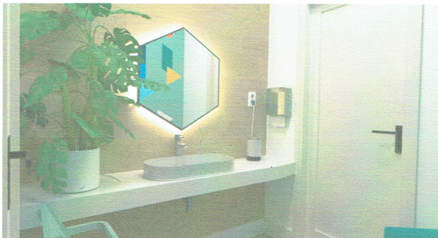
wizualizacja - rozwiązania materiałowe i kolorystyczne