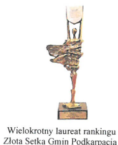
Wielokrotny laureat rankingu Złota Setka Gmin Podkarpacia