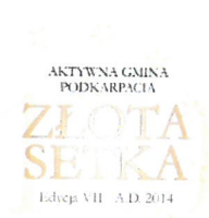
Skuteczny beneficjent środków unijnych