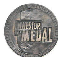
Wyróżnienie w kat. „Inwestor na Medal” w konkursie „Budowniczy Polskiego Sportu”