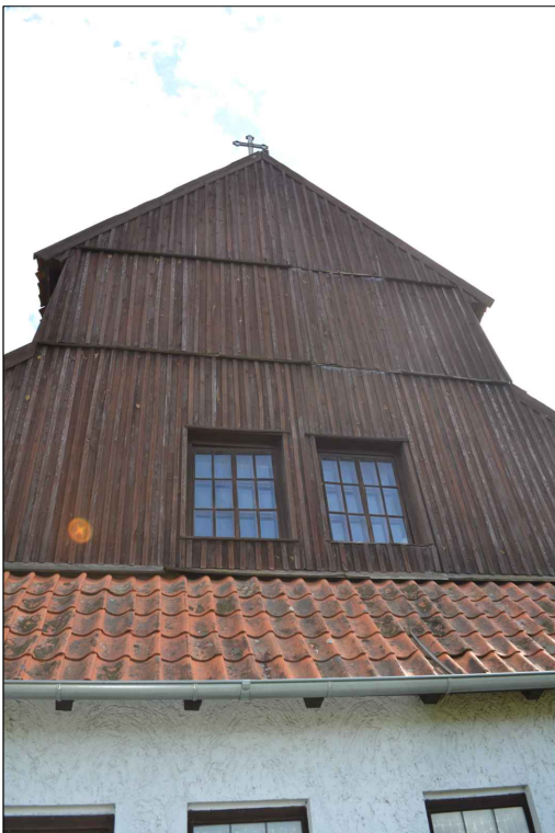
FOT. 5 Elewacja zachodnia obiektu. Opierzenie wieży kościoła.