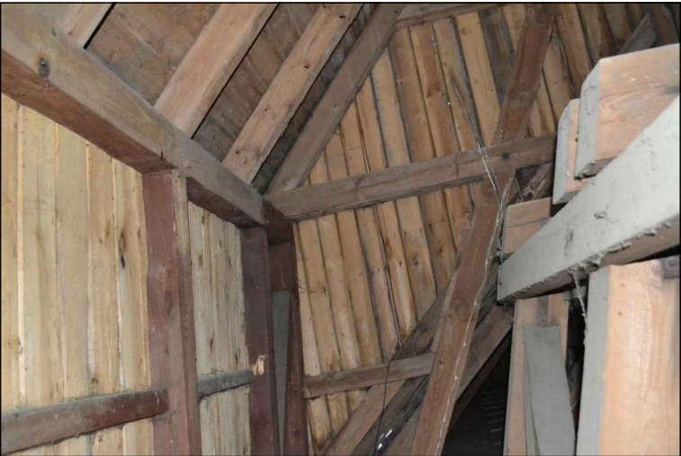
FOT. 32 Widok opierzenia wieży od wewnątrz od strony nawy głównej.