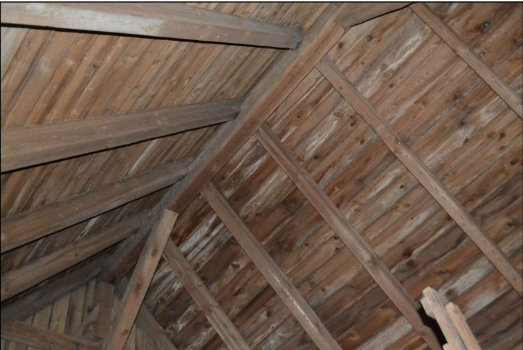
FOT. 33 Więźba dachowa wieży.