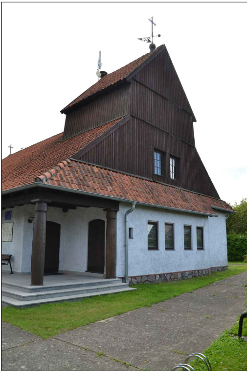
FOT. 4 Elewacja wschodnia obiektu.