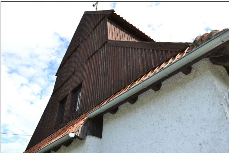
FOT. 6 Elewacja zachodnia obiektu.