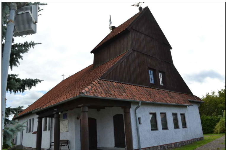
FOT. 3 Elewacja zachodnia obiektu. Wejście do kościoła.