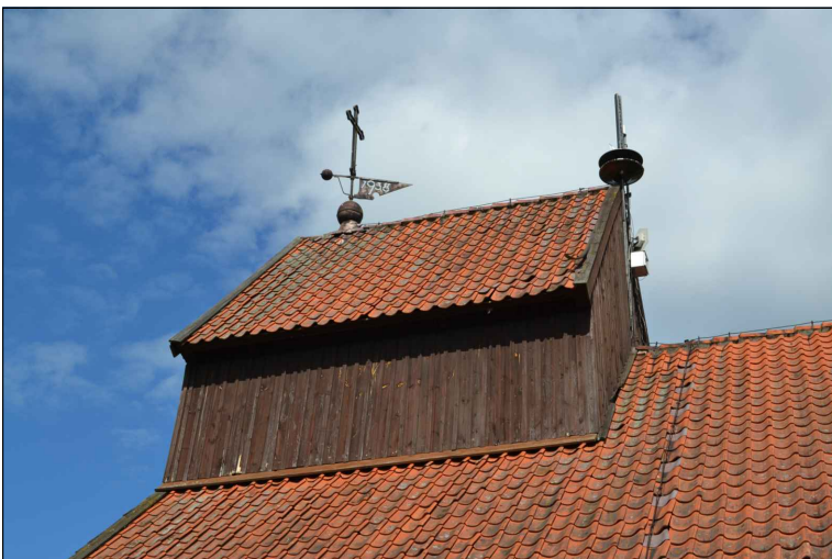
FOT. 8 Elewacja południowa obiektu.