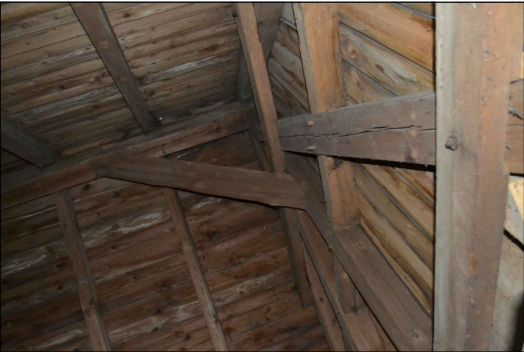
FOT. 34 Więźba dachowa wieży.