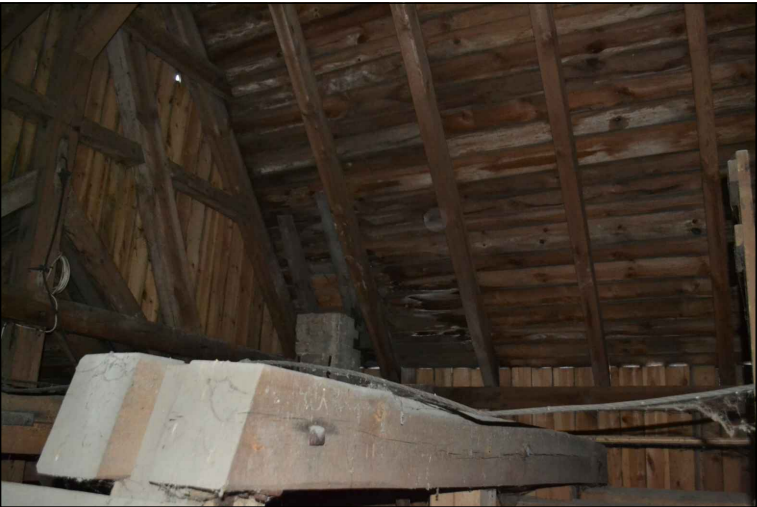
FOT. 31 Więźba dachowa wieży.