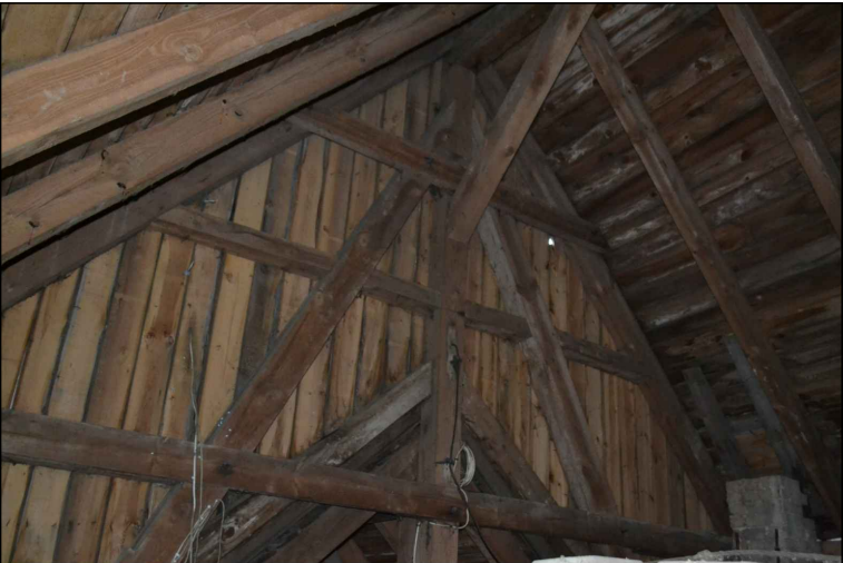
FOT. 30 Widok opierzenia wieży od wewnątrz od strony nawy głównej.