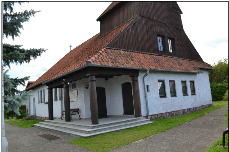
FOT. 2 Elewacja zachodnia obiektu. Wejście do kościoła.