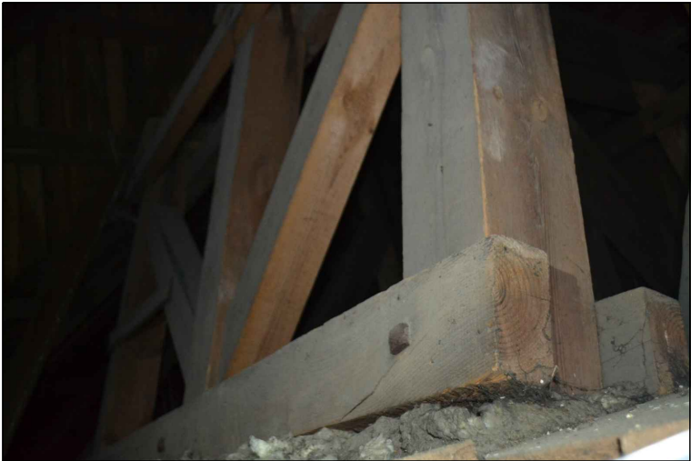
FOT. 28Drewniana konstrukcja pod dzwon.