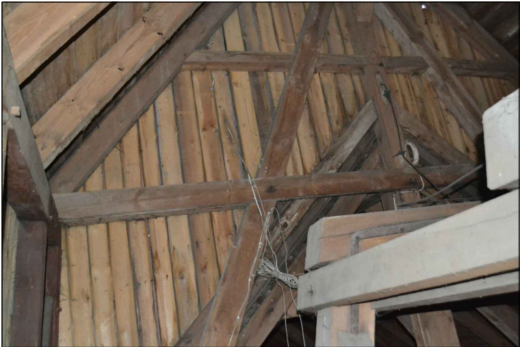
FOT. 29 Widok opierzenia wieży od wewnątrz od strony nawy głównej.