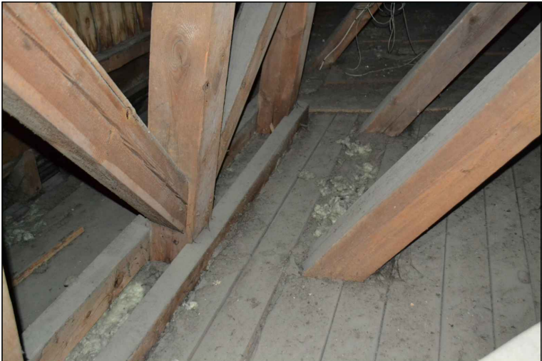
FOT. 27Elementy więźby dachowej wieży.