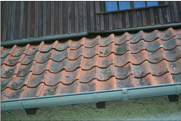
FOT. 7 Elewacja zachodnia obiektu.