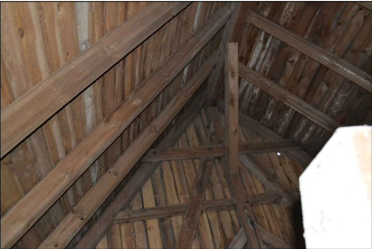
FOT. 35 Więźba dachowa wieży.