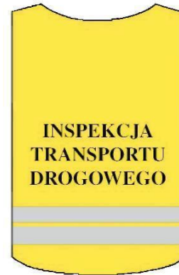
Kamizelka ostrzegawcza tył