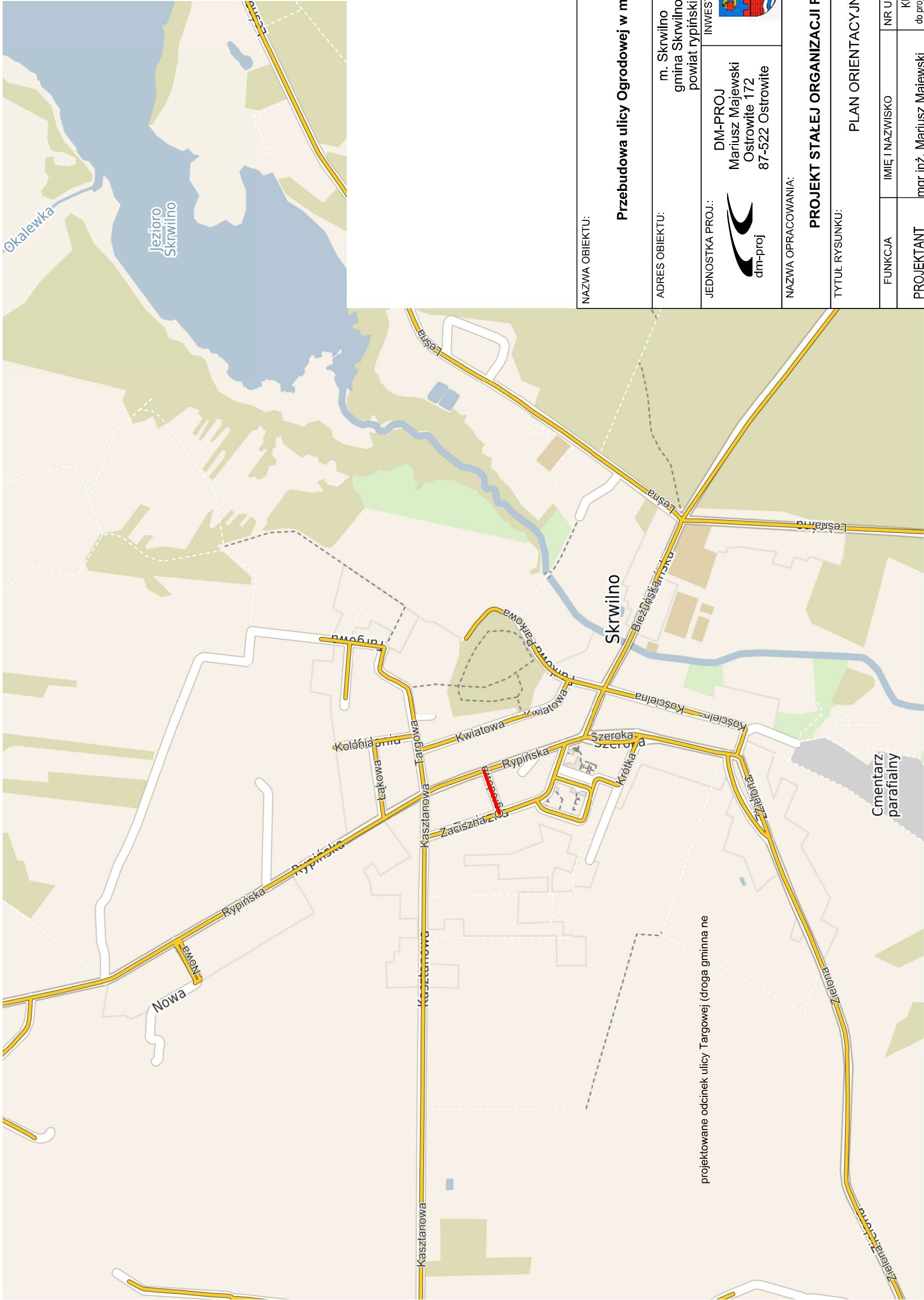
PLAN ORIENTACYJNY SKALA 1:10000